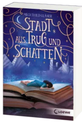
Stadt aus Trug und Schatten (Eisenheim- Dilogie, Band 1) Taschenbuch