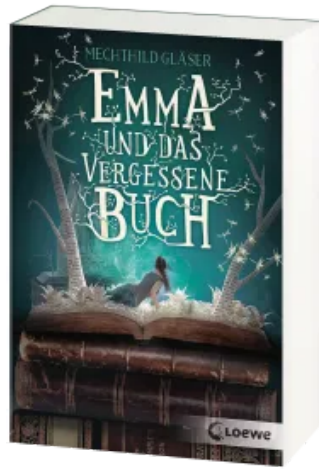
Emma und das vergessene Buch Taschenbuch