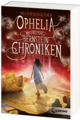
Ophelia und die Bernsteinchroniken Taschenbuch