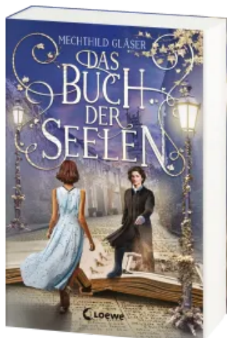
Das Buch der Seelen Paperback