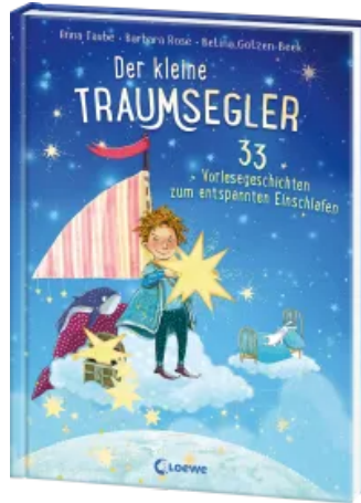
Der kleine Traumsegler (Band 2) Hardcover