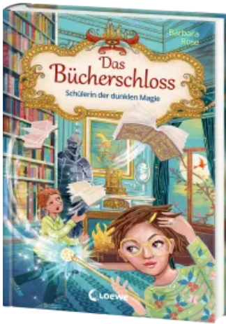
Das Bücherschloss (Band 6) - Schülerin der dunklen Magie Hardcover