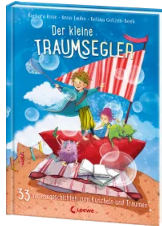
Der kleine Traumsegler (Band 4) Hardcover