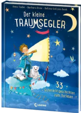
Der kleine Traumsegler (Band 1) Hardcover