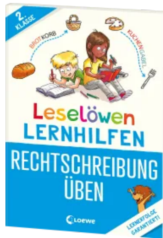
Leselöwen Lernhilfen - Rechtschreibung üben - 2. Klasse Taschenbuch