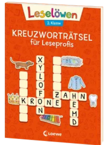
Leselöwen Kreuzworträtsel für Leseprofis - 2. Klasse (Rotorange) Taschenbuch