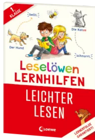
Leselöwen Lernhilfen - Leichter lesen - 1. Klasse Taschenbuch