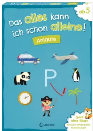
Das alles kann ich schon alleine! Anlaute Taschenbuch