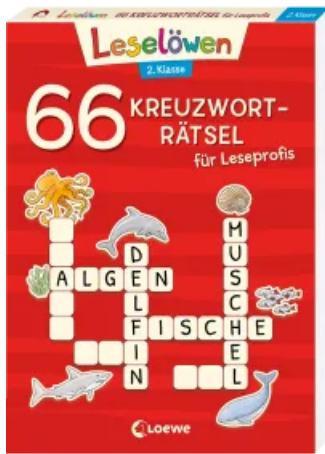
66 Kreuzworträtsel für Leseprofis - 2. Klasse (Rot) Taschenbuch