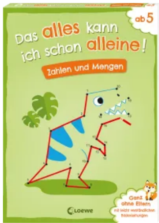
Das alles kann ich schon alleine! Zahlen und Mengen Taschenbuch