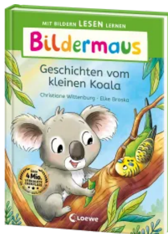
Bildermaus - Geschichten vom kleinen Koala Hardcover