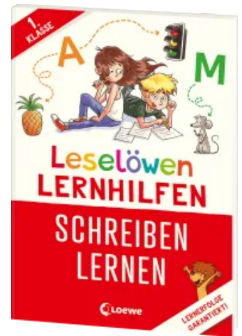
Leselöwen Lernhilfen - Schreiben lernen - 1. Klasse Taschenbuch