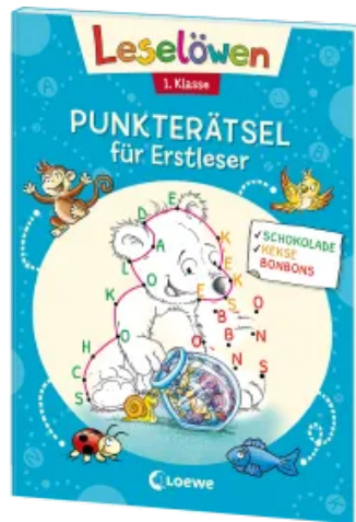
Leselöwen Punkterätsel für Erstleser - 1. Klasse (Blau) Taschenbuch