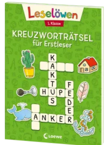
Leselöwen Kreuzworträtsel für Erstleser - 1. Klasse (Grün) Taschenbuch