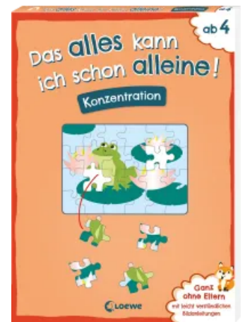
Das alles kann ich schon alleine! Konzentration Taschenbuch