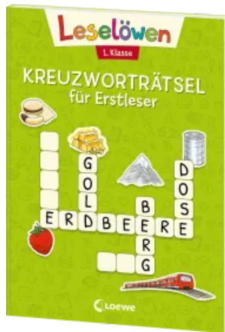
Leselöwen Kreuzworträtsel für Erstleser - 1. Klasse (Hellgrün) Taschenbuch