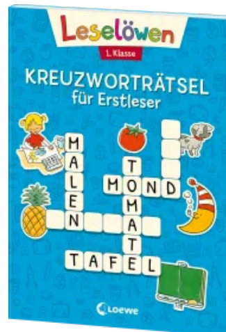
Leselöwen Kreuzworträtsel für Erstleser - 1. Klasse (Blau) Taschenbuch