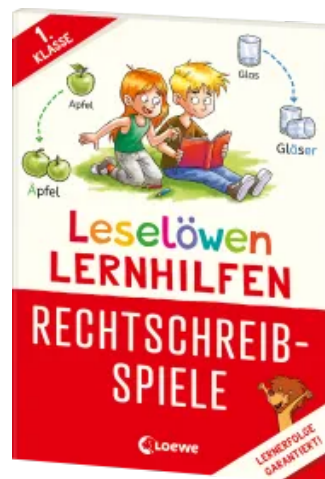
Leselöwen Lernhilfen - Rechtschreib-Spiele - 1. Klasse Taschenbuch