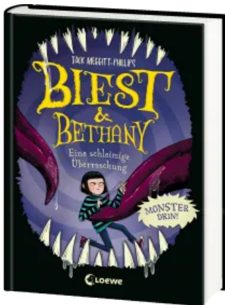
Biest & Bethany (Band 3) - Eine schleimige Überraschung Hardcover