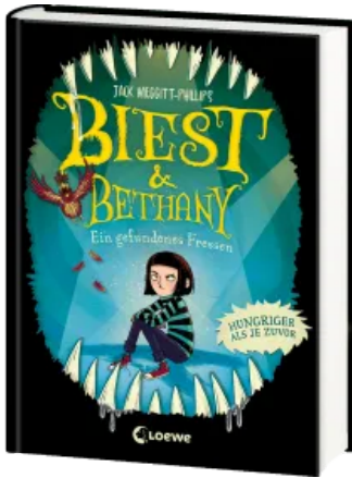
Biest & Bethany (Band 2) - Ein gefundenes Fressen Hardcover