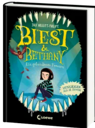
Biest & Bethany (Band 2) - Ein gefundenes Fressen Hardcover