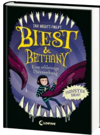
Biest & Bethany (Band 3) - Eine schleimige Überraschung Hardcover