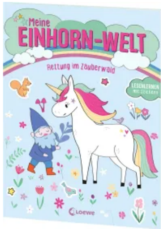
Meine Einhorn-Welt - Rettung im Zauberwald Taschenbuch