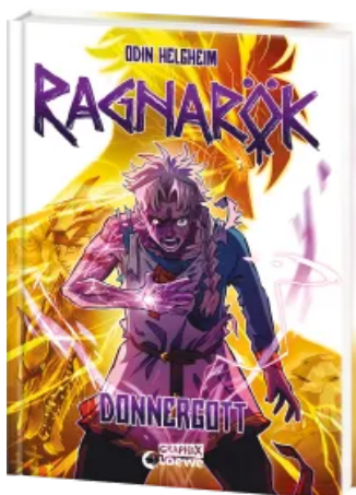
Ragnarök (Band 3) - Donnergott Hardcover