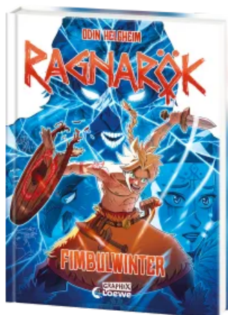
Ragnarök (Band 2) - Fimbulwinter Hardcover