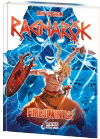
Ragnarök (Band 2) - Fimbulwinter Hardcover