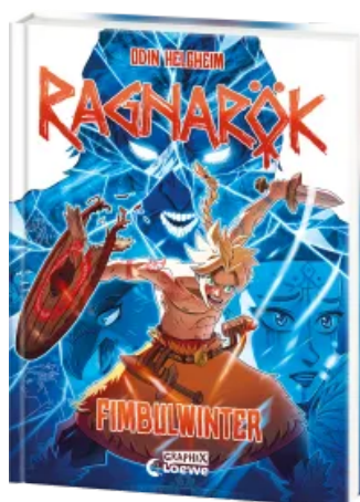
Ragnarök (Band 2) - Fimbulwinter Hardcover