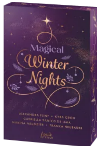
Magical Winter Nights Paperback