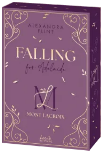
Mont Lacroix (Band 2) - Falling for Adelaide Paperback