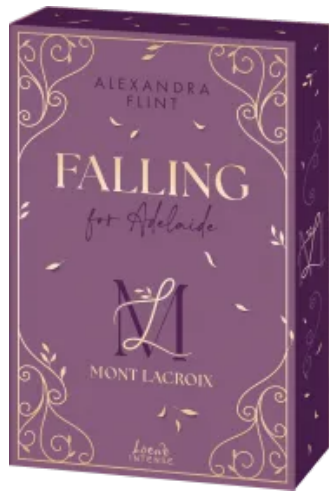
Mont Lacroix (Band 2) - Falling for Adelaide Paperback