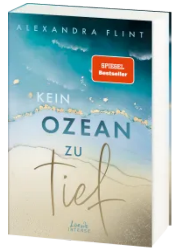
Kein Ozean zu tief (Tales of Sylt, Band 3) Paperback