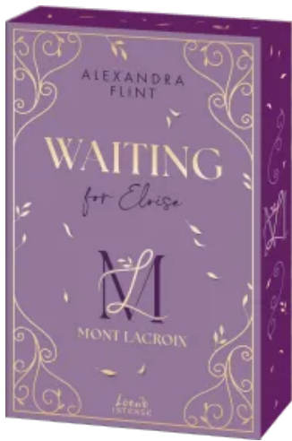
Mont Lacroix (Band 3) - Waiting for Eloise Paperback