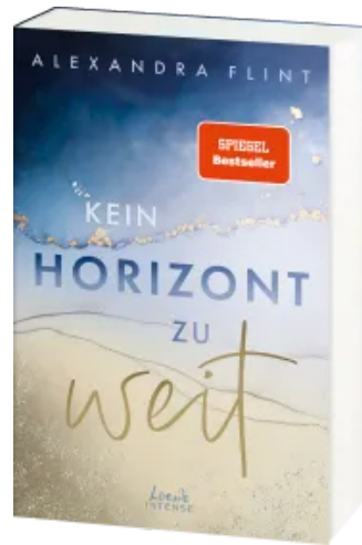
Kein Horizont zu weit (Tales of Sylt, Band 1) Paperback