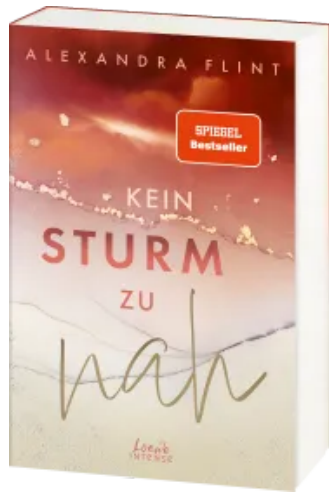
Kein Sturm zu nah (Tales of Sylt, Band 2) Paperback