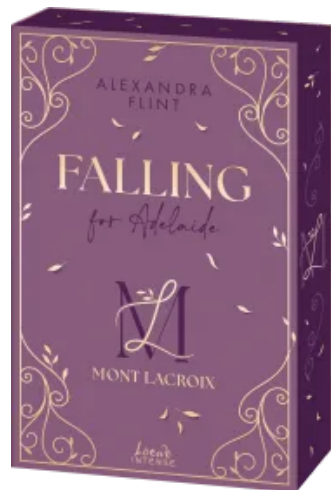
Mont Lacroix (Band 2) - Falling for Adelaide Paperback