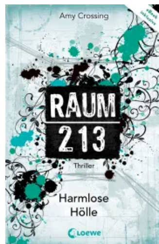
Raum 213 – Harmlose Hölle Paperback