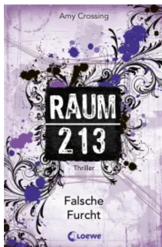
Raum 213 (Band 4) – Falsche Furcht Paperback