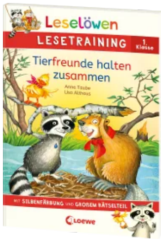
Leselöwen Lesetraining 1. Klasse - Tierfreunde halten zusammen Taschenbuch