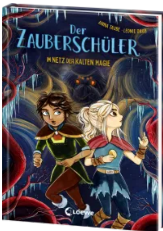
Der Zauberschüler (Band 8) - Im Netz der kalten Magie Hardcover