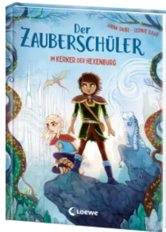
Der Zauberschüler (Band 5) - Im Kerker der Hexenburg Hardcover