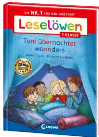
Leselöwen 1. Klasse - Toni übernachtet woanders Hardcover