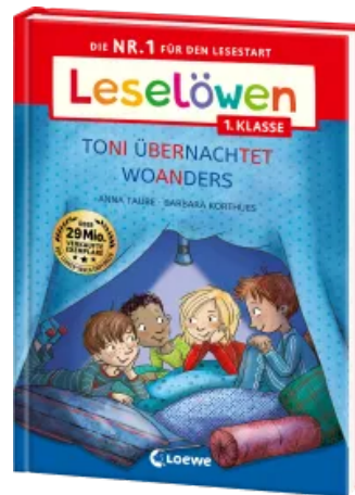
Leselöwen 1. Klasse - Toni übernachtet woanders (Großbuchstabenausgabe) Hardcover