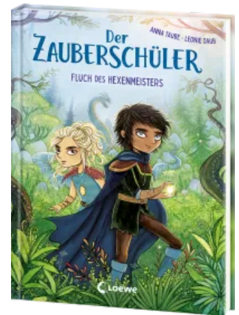
Der Zauberschüler (Band 1) - Fluch des Hexenmeisters Hardcover