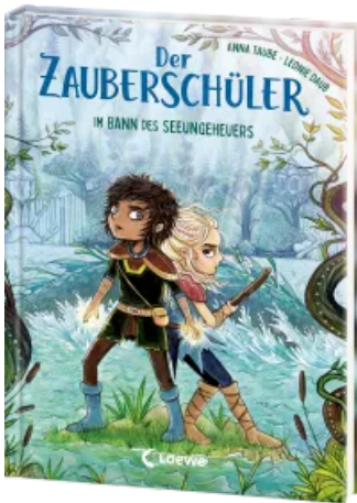
Der Zauberschüler (Band 2) - Im Bann des Seeungeheuers Hardcover