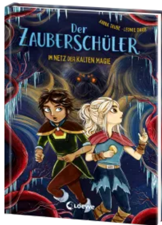
Der Zauberschüler (Band 8) - Im Netz der kalten Magie Hardcover