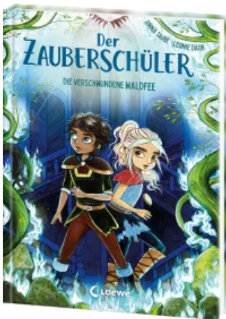
Der Zauberschüler (Band 7) - Die verschwundene Waldfee Hardcover