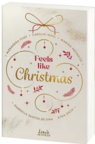
Feels like Christmas Paperback