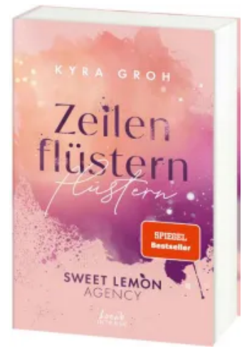
Zeilenflüstern (Sweet Lemon Agency, Band 1) Paperback