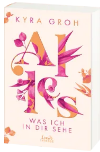
Alles, was ich in dir sehe (Alles-Trilogie, Band 1) Paperback