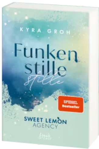
Funkenstille (Sweet Lemon Agency, Band 3) Paperback