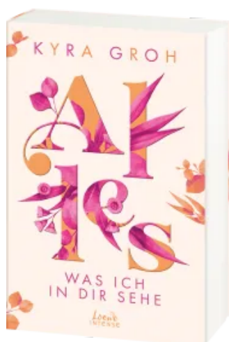
Alles, was ich in dir sehe (Alles-Trilogie, Band 1) Paperback