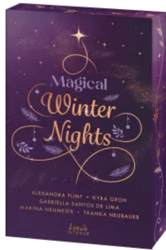
Magical Winter Nights Paperback