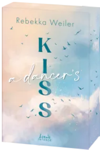
A Dancer's Kiss (Broken Artists, Band 2) Paperback