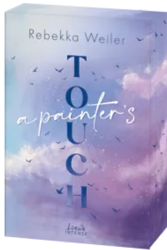
A Painter's Touch (Broken Artists, Band 3) Paperback