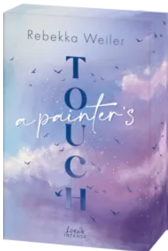
A Painter's Touch (Broken Artists, Band 3) Paperback