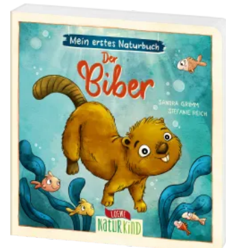
Mein erstes Naturbuch - Der Biber Hardcover