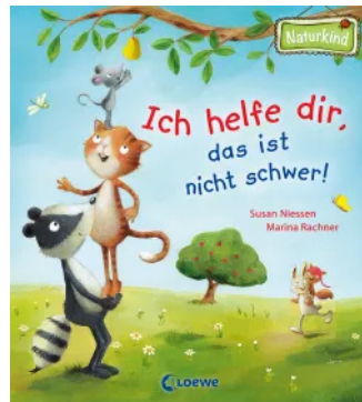
Ich helfe dir, das ist nicht schwer! Hardcover