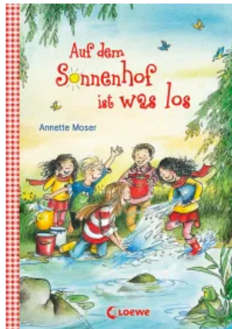
Auf dem Sonnenhof ist was los Hardcover