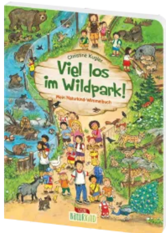
Viel los im Wildpark! Hardcover