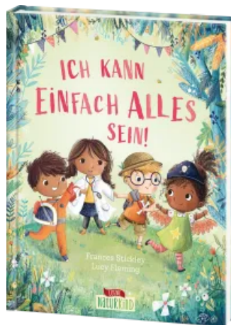
Ich kann einfach alles sein! Hardcover