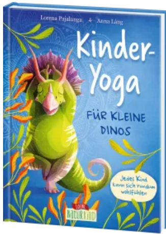
Kinder-Yoga für kleine Dinos Hardcover