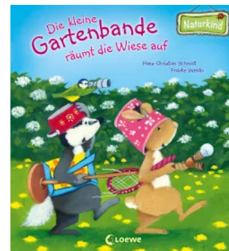
Die kleine Gartenbande räumt die Wiese auf Hardcover