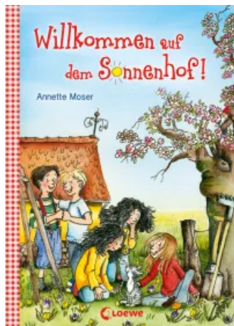
Willkommen auf dem Sonnenhof! Hardcover