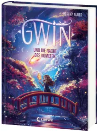
Gwin und die Nacht des Kometen (Band 2) Hardcover