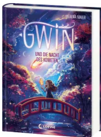
Gwin und die Nacht des Kometen (Band 2) Hardcover