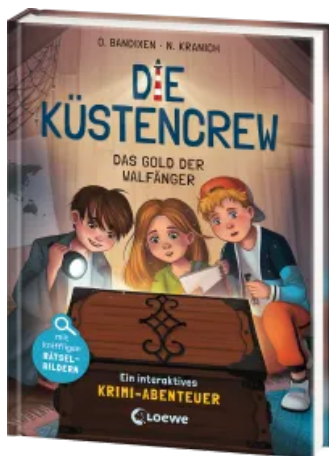
Die Küstencrew (Band 1) - Das Gold der Walfänger Hardcover