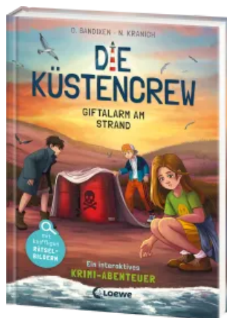
Die Küstencrew (Band 5) - Giftalarm am Strand Hardcover