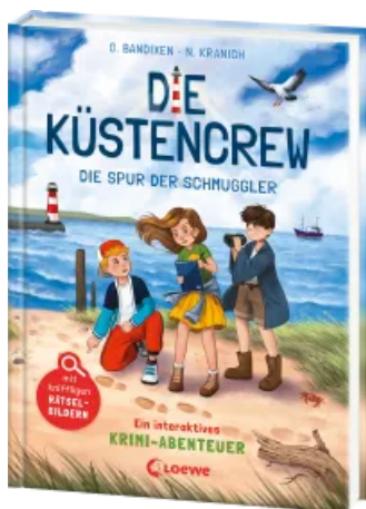
Die Küstencrew (Band 2) - Die Spur der Schmuggler Hardcover