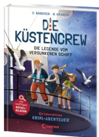
Die Küstencrew (Band 4) - Die Legende vom versunkenen Schiff Hardcover