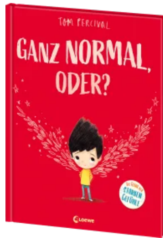
Ganz normal, oder? (Die Reihe der starken Gefühle) Hardcover