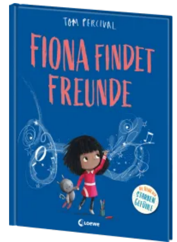
Fiona findet Freunde (Die Reihe der starken Gefühle) Hardcover