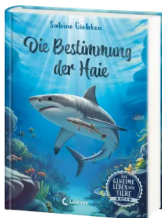
Das geheime Leben der Tiere (Meer) - Die Bestimmung der Haie Hardcover