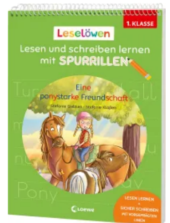
Leselöwen - Lesen und schreiben lernen mit Spurrillen - Eine ponystarke Freundschaft Taschenbuch