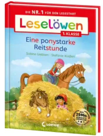
Leselöwen 1. Klasse - Eine ponystarke Reitstunde Hardcover