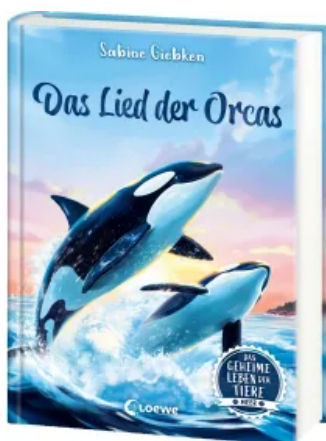
Das geheime Leben der Tiere (Meer) - Das Lied der Orcas Hardcover