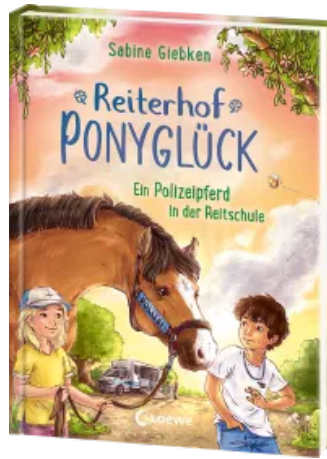
Reiterhof Ponyglück (Band 2) - Ein Polizeipferd in der Reitschule Hardcover