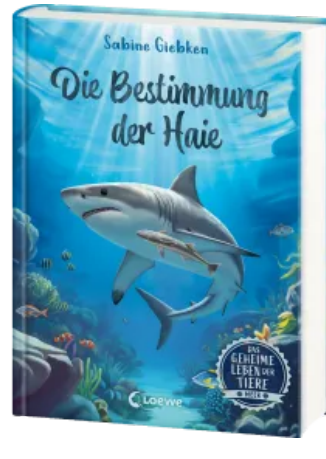
Das geheime Leben der Tiere (Meer) - Die Bestimmung der Haie Hardcover