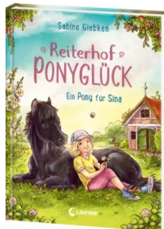
Reiterhof Ponyglück (Band 1) - Ein Pony für Sina Hardcover