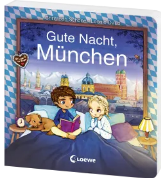
Gute Nacht, München Hardcover