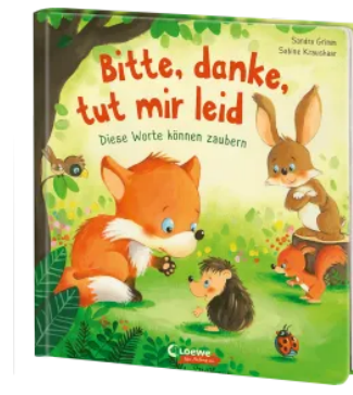
Bitte, danke, tut mir leid Hardcover