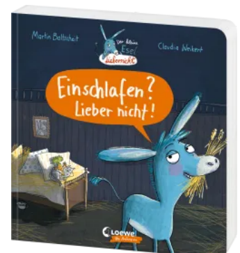
Der kleine Esel Lieber nicht - Einschlafen? Lieber nicht! Hardcover