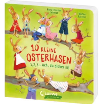
10 kleine Osterhasen Hardcover