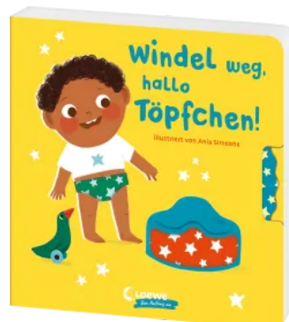
Windel weg, hallo Töpfchen! Hardcover