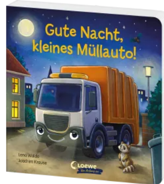
Gute Nacht, kleines Müllauto! Hardcover