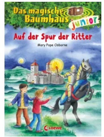
Das magische Baumhaus junior (Band 2) - Auf der Spur der Ritter Hardcover