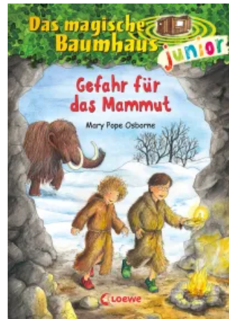
Das magische Baumhaus junior (Band 7) - Gefahr für das Mammut Hardcover