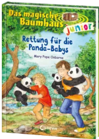
Das magische Baumhaus junior (Band 41) - Rettung für die Panda-Babys Hardcover