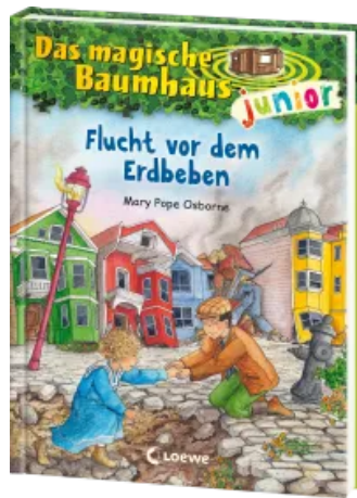
Das magische Baumhaus junior (Band 22) - Flucht vor dem Erdbeben Hardcover