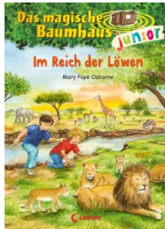
Das magische Baumhaus junior (Band 11) - Im Reich der Löwen Hardcover