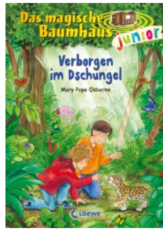
Das magische Baumhaus junior (Band 6) - Verborgen im Dschungel Hardcover