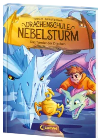
Drachenschule Nebelsturm (Band 3) - Das Turnier der Drachen Hardcover