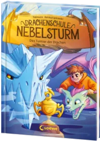
Drachenschule Nebelsturm (Band 3) - Das Turnier der Drachen Hardcover