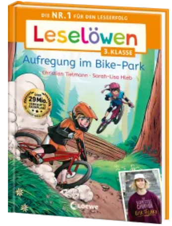
Leselöwen 3. Klasse - Aufregung im Bike-Park Hardcover