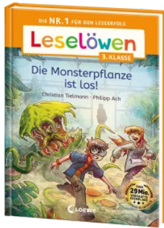
Leselöwen 3. Klasse - Die Monsterpflanze ist los! Hardcover