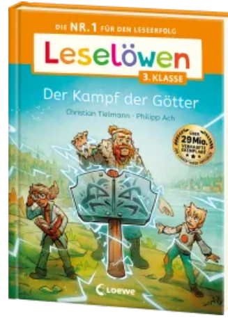
Leselöwen 3. Klasse - Der Kampf der Götter Hardcover