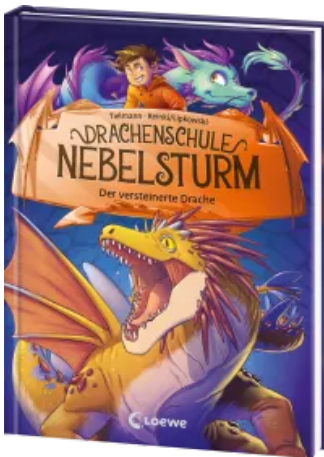
Drachenschule Nebelsturm (Band 5) - Der versteinerte Drache Hardcover