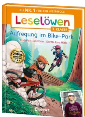
Leselöwen 3. Klasse - Aufregung im Bike-Park Hardcover