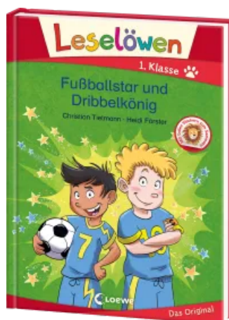
Leselöwen 1. Klasse - Fußballstar und Dribbelkönig Hardcover