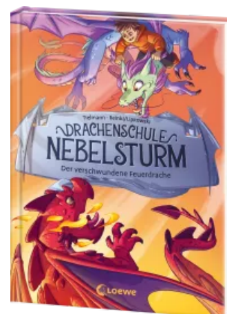
Drachenschule Nebelsturm (Band 2) - Der verschwundene Feuerdrache Hardcover