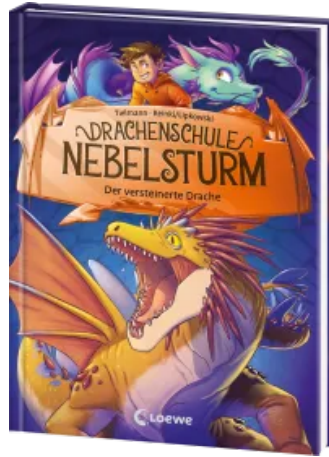
Drachenschule Nebelsturm (Band 5) - Der versteinerte Drache Hardcover