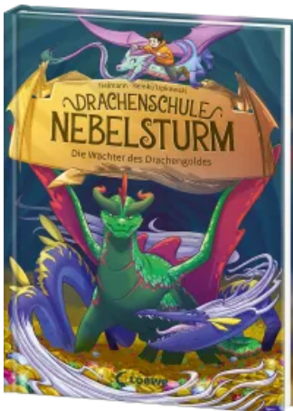
Drachenschule Nebelsturm (Band 4) - Die Wächter des Drachengoldes Hardcover