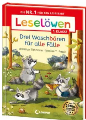
Leselöwen 1. Klasse - Drei Waschbären für alle Fälle Hardcover