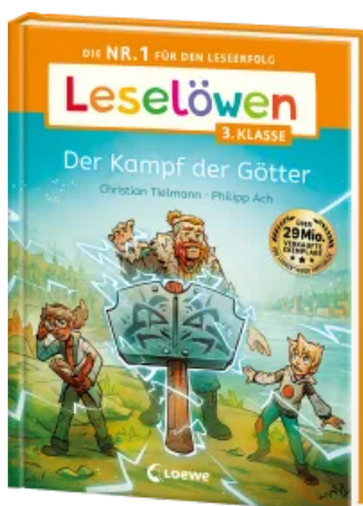
Leselöwen 3. Klasse - Der Kampf der Götter Hardcover