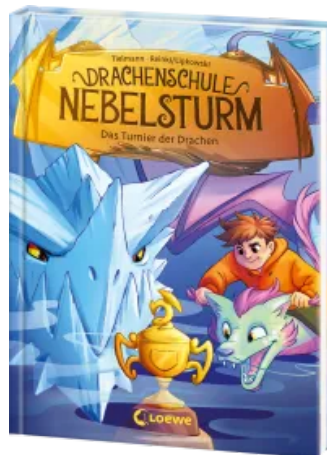
Drachenschule Nebelsturm (Band 3) - Das Turnier der Drachen Hardcover