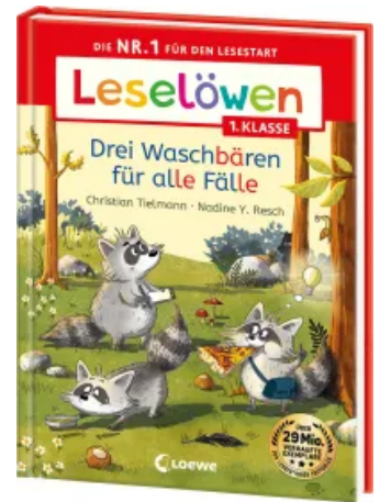
Leselöwen 1. Klasse - Drei Waschbären für alle Fälle Hardcover