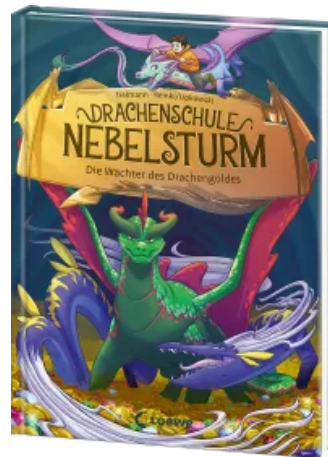
Drachenschule Nebelsturm (Band 4) - Die Wächter des Drachengoldes Hardcover