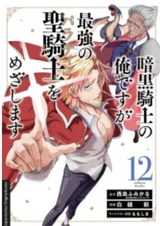
Dark Paladin 12 Taschenbuch