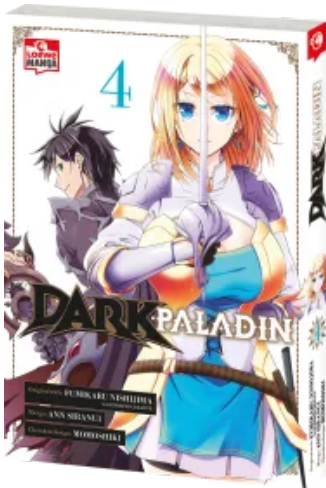
Dark Paladin 04 Taschenbuch