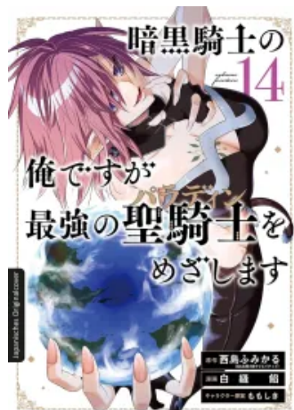
Dark Paladin 14 Taschenbuch