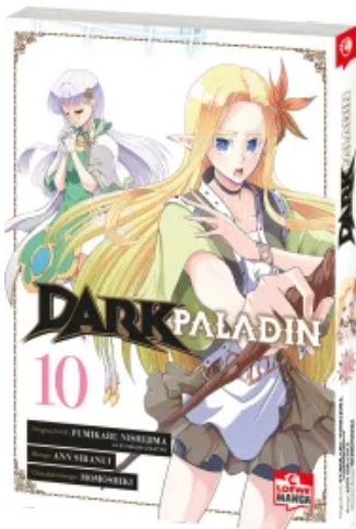
Dark Paladin 10 Taschenbuch