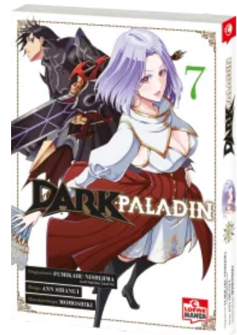
Dark Paladin 07 Taschenbuch