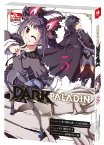
Dark Paladin 05 Taschenbuch