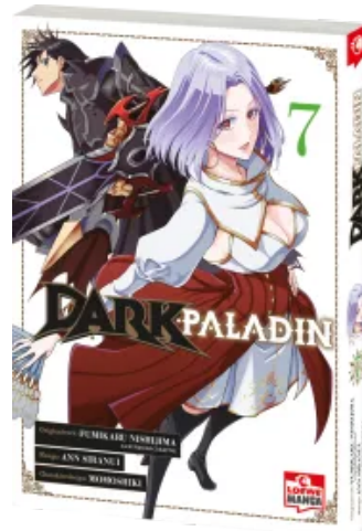
Dark Paladin 07 Taschenbuch