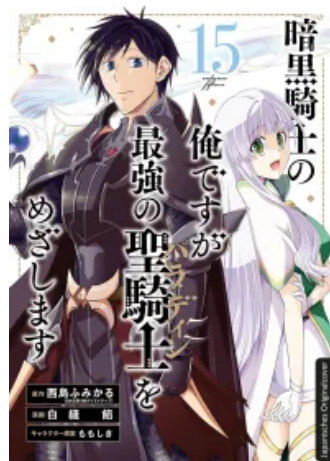
Dark Paladin 15 Taschenbuch