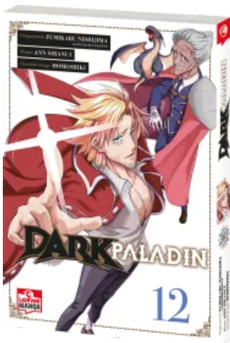
Dark Paladin 12 Taschenbuch