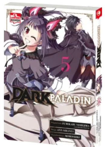
Dark Paladin 05 Taschenbuch