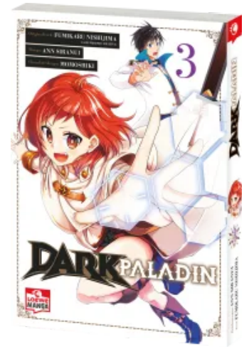
Dark Paladin 03 Taschenbuch