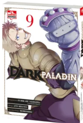
Dark Paladin 09 Taschenbuch