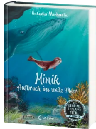
Das geheime Leben der Tiere (Ozean) - Minik - Aufbruch ins weite Meer Hardcover