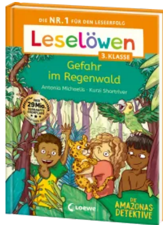
Leselöwen 3. Klasse - Amazonas-Detektive: Gefahr im Regenwald Hardcover