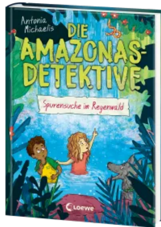
Die Amazonas-Detektive (Band 3) - Spurensuche im Regenwald Hardcover