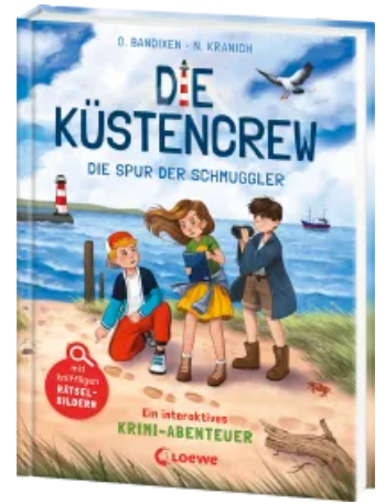
Die Küstencrew (Band 2) - Die Spur der Schmuggler Hardcover