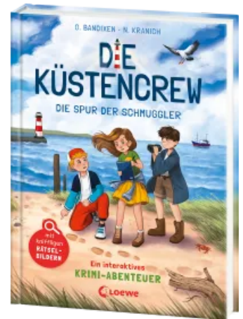
Die Küstencrew (Band 2) - Die Spur der Schmuggler Hardcover