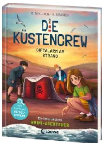
Die Küstencrew (Band 5) - Giftalarm am Strand Hardcover