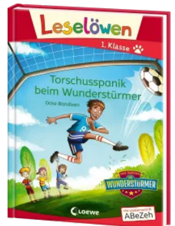
Leselöwen 1. Klasse - Torschusspanik beim Wunderstürmer Hardcover