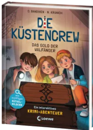
Die Küstencrew (Band 1) - Das Gold der Walfänger Hardcover