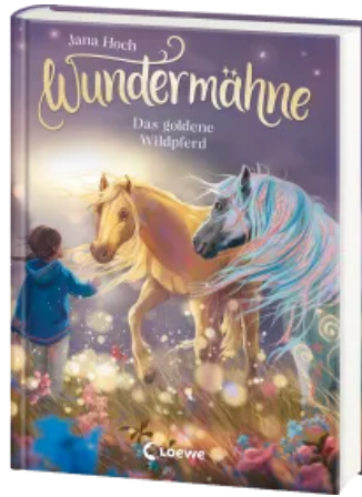
Wundermähne (Band 4) - Das goldene Wildpferd Hardcover