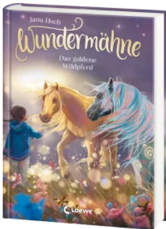
Wundermähne (Band 4) - Das goldene Wildpferd Hardcover