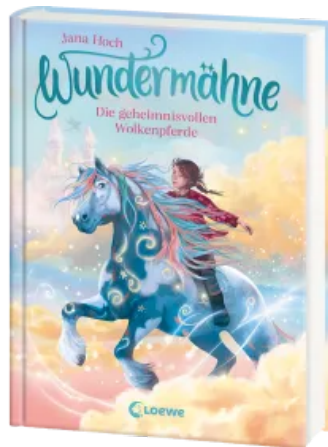
Wundermähne (Band 5) - Die geheimnisvollen Wolkenpferde Hardcover