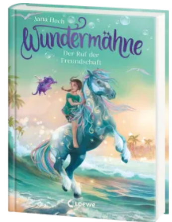
Wundermähne (Band 3) - Der Ruf der Freundschaft Hardcover