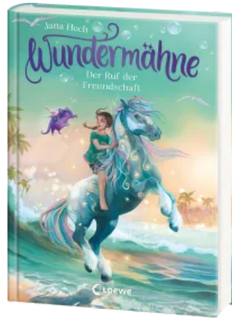
Wundermähne (Band 3) - Der Ruf der Freundschaft Hardcover