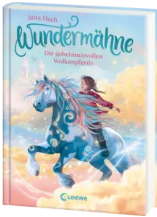
Wundermähne (Band 5) - Die geheimnisvollen Wolkenpferde Hardcover