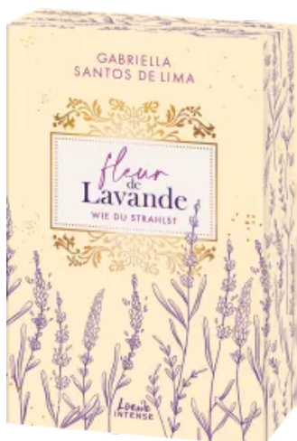
Fleur de Lavande (Band 2) - Wie du strahlst Paperback