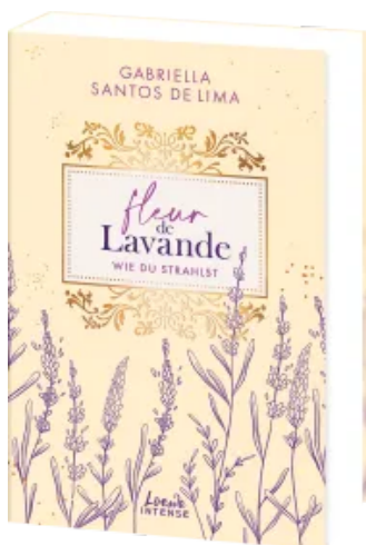
Fleur de Lavande (Band 2) - Wie du strahlst Paperback