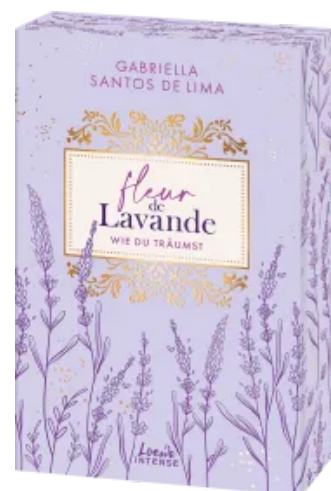
Fleur de Lavande (Band 3) - Wie du träumst Paperback