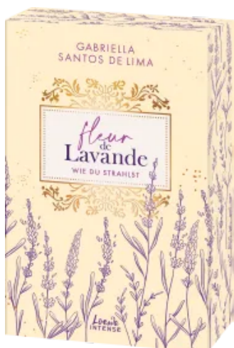
Fleur de Lavande (Band 2) - Wie du strahlst Paperback