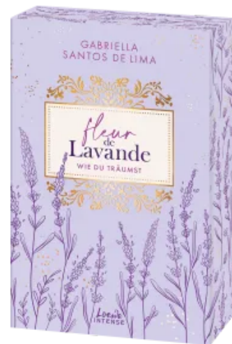
Fleur de Lavande (Band 3) - Wie du träumst Paperback