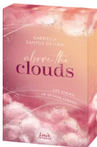
Above the Clouds (Band 1) - Der Himmel in deinen Farben Paperback