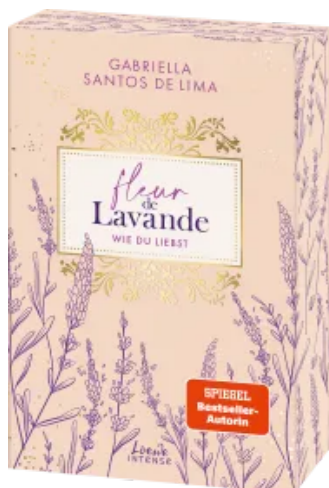
Fleur de Lavande (Band 1) - Wie du liebst Paperback