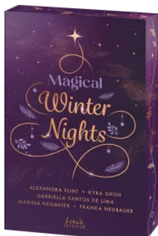
Magical Winter Nights Paperback