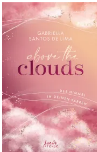
Above the Clouds (Band 1) - Der Himmel in deinen Farben Paperback