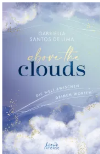
Above the Clouds (Band 2) - Die Welt zwischen deinen Worten Paperback