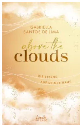
Above the Clouds (Band 3) - Die Sterne auf deiner Haut Paperback