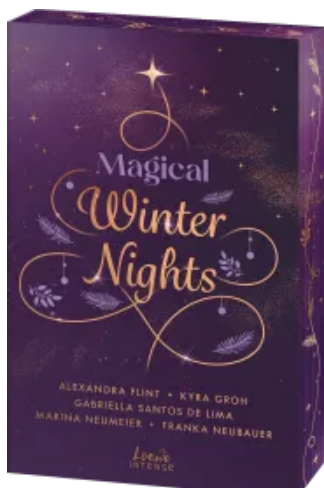
Magical Winter Nights Paperback