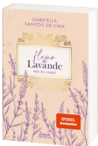
Fleur de Lavande (Band 1) - Wie du liebst Paperback