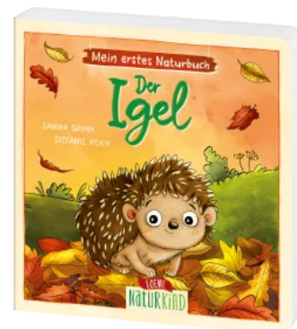
Mein erstes Naturbuch - Der Igel Hardcover