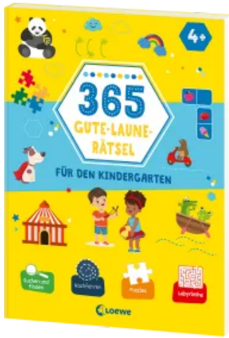
365 Gute-Laune-Rätsel für den Kindergarten Taschenbuch