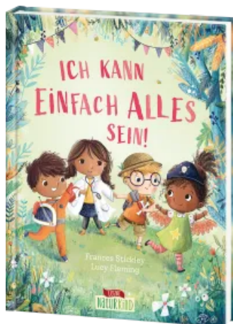
Ich kann einfach alles sein! Hardcover