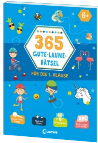
365 Gute-Laune-Rätsel für die 1. Klasse Taschenbuch