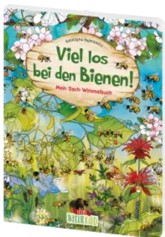
Viel los bei den Bienen! Hardcover