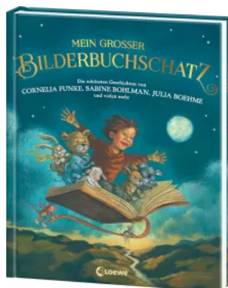
Mein großer Bilderbuchschatz Hardcover