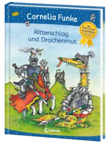
Ritterschlag und Drachenmut Hardcover