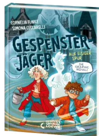
Gespensterjäger auf eisiger Spur (Band 1) - Die Graphic Novel Hardcover