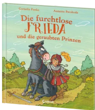
Die furchtlose Frieda und die geraubten Prinzen Hardcover