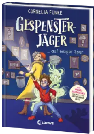
Gespensterjäger auf eisiger Spur (Band 1) - Mit 8 neu illustrierten Farbseiten Hardcover