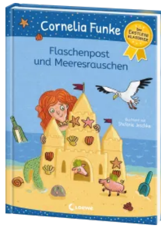
Flaschenpost und Meeresrauschen Hardcover