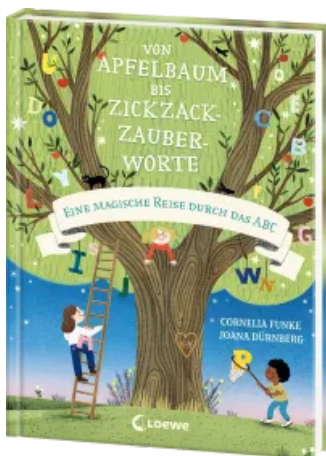
Von Apfelbaum bis Zickzackzauberworte Hardcover