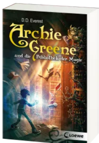
Archie Greene und die Bibliothek der Magie (Band 1) Taschenbuch