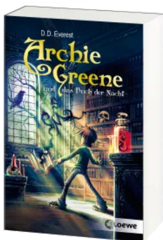
Archie Greene und das Buch der Nacht (Band 3) Taschenbuch