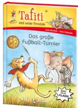
Tafiti und seine Freunde (Band 1) - Das große Fußball-Turnier Hardcover