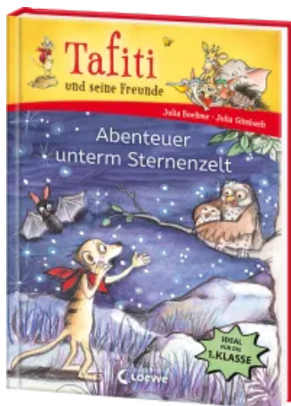
Tafiti und seine Freunde (Band 2) - Abenteuer unterm Sternenzelt Hardcover