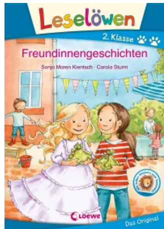
Leselöwen 2. Klasse - Freundinnengeschichten Hardcover