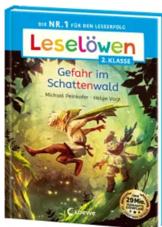
Leselöwen 2. Klasse - Gefahr im Schattenwald Hardcover