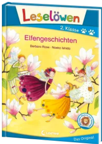
Leselöwen 2. Klasse - Elfengeschichten Hardcover