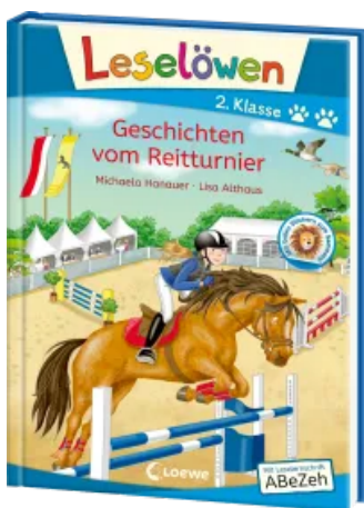
Leselöwen 2. Klasse - Geschichten vom Reitturnier Hardcover