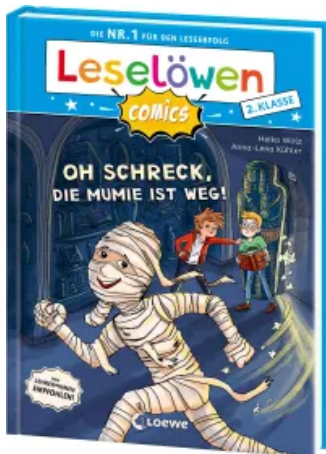
Leselöwen Comics 2. Klasse - Oh Schreck, die Mumie ist weg! Hardcover