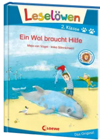
Leselöwen 2. Klasse - Ein Wal braucht Hilfe Hardcover