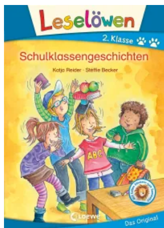
Leselöwen 2. Klasse - Schulklassengeschichten Hardcover