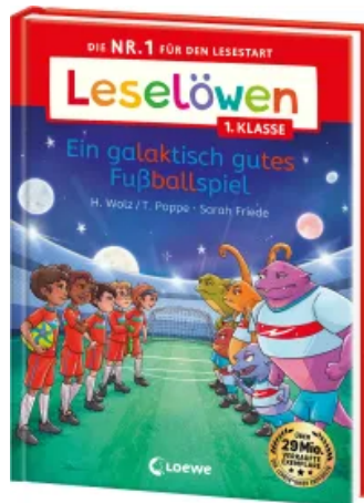
Leselöwen 1. Klasse - Ein galaktisch gutes Fußballspiel Hardcover