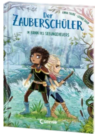
Der Zauberschüler (Band 2) - Im Bann des Seeungeheuers Hardcover