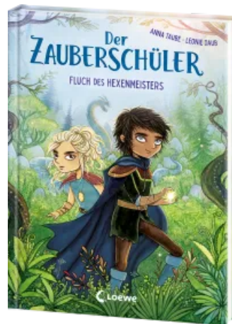
Der Zauberschüler (Band 1) - Fluch des Hexenmeisters Hardcover