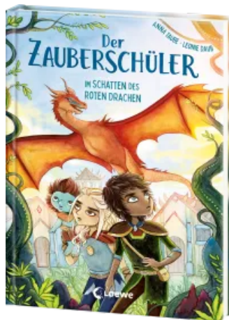
Der Zauberschüler (Band 3) - Im Schatten des roten Drachen Hardcover