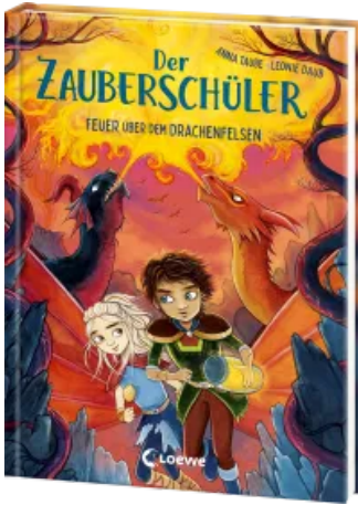
Der Zauberschüler (Band 6) - Feuer über dem Drachenfelsen Hardcover