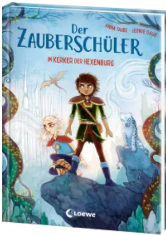
Der Zauberschüler (Band 5) - Im Kerker der Hexenburg Hardcover