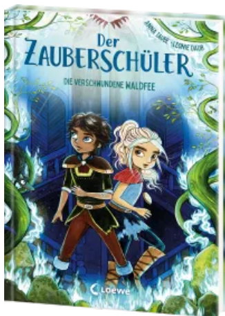
Der Zauberschüler (Band 7) - Die verschwundene Waldfee Hardcover