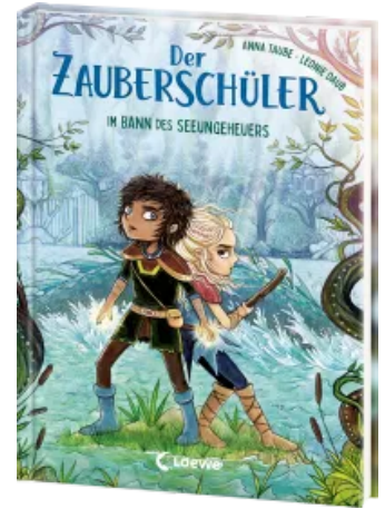
Der Zauberschüler (Band 2) - Im Bann des Seeungeheuers Hardcover