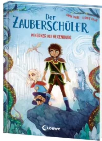
Der Zauberschüler (Band 5) - Im Kerker der Hexenburg Hardcover