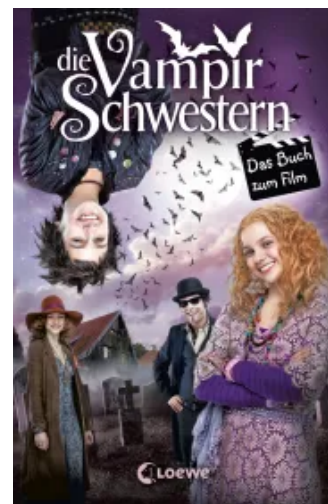
Die Vampirschwestern - Das Buch zum Film Hardcover