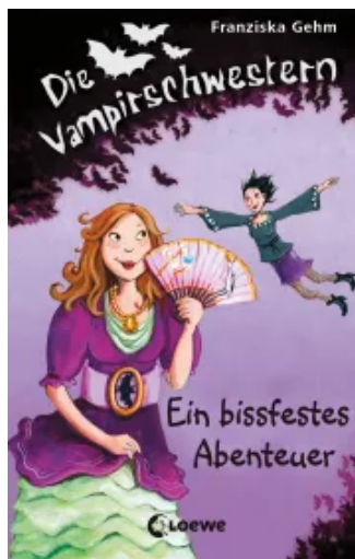
Die Vampirschwestern (Band 2) - Ein bissfestes Abenteuer Hardcover