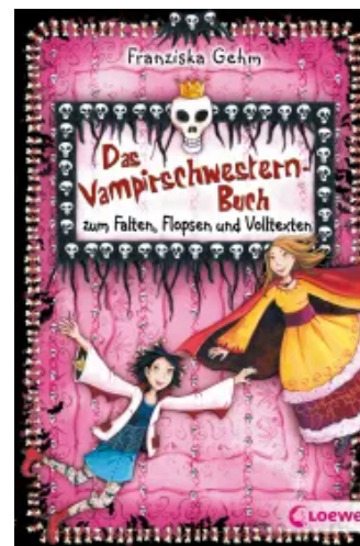
Das Vampirschwestern-Buch Unbekannt