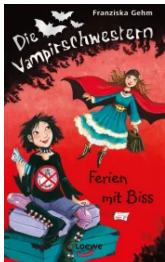
Die Vampirschwestern (Band 5) - Ferien mit Biss Hardcover