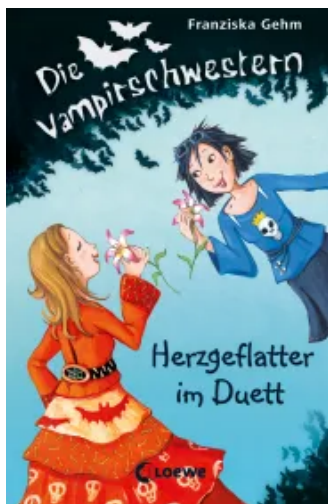
Die Vampirschwestern (Band 4) - Herzgeflatter im Duett Hardcover