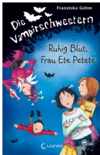
Die Vampirschwestern (Band 12) - Ruhig Blut, Frau Ete Petete Hardcover