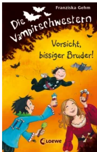
Die Vampirschwestern (Band 11) - Vorsicht, bissiger Bruder! Hardcover