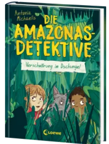
Die Amazonas-Detektive (Band 1) - Verschwörung im Dschungel Hardcover