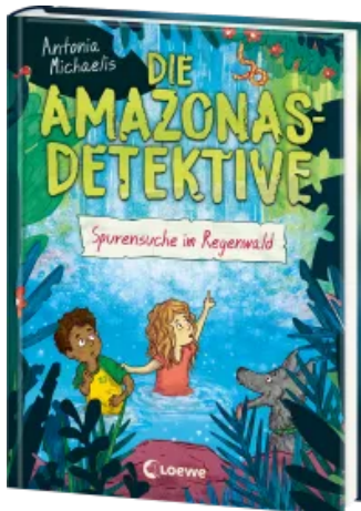
Die Amazonas-Detektive (Band 3) - Spurensuche im Regenwald Hardcover