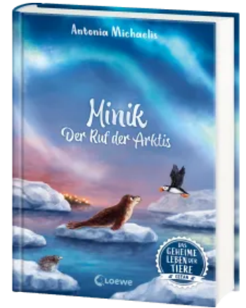
Das geheime Leben der Tiere (Ozean) - Minik - Der Ruf der Arktis Hardcover