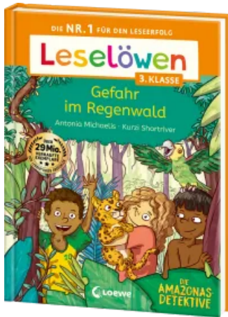
Leselöwen 3. Klasse - Amazonas-Detektive: Gefahr im Regenwald Hardcover