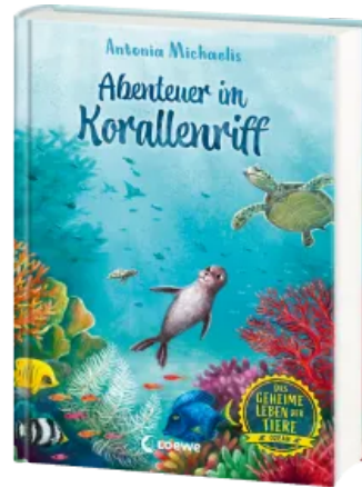
Das geheime Leben der Tiere (Ozean) - Abenteuer im Korallenriff Hardcover