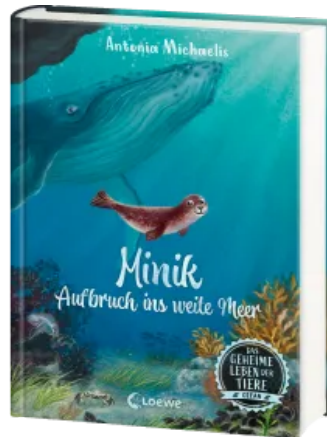
Das geheime Leben der Tiere (Ozean) - Minik - Aufbruch ins weite Meer Hardcover