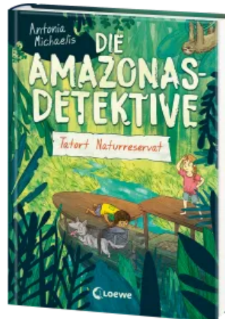
Die Amazonas-Detektive (Band 2) - Tatort Naturreservat Hardcover