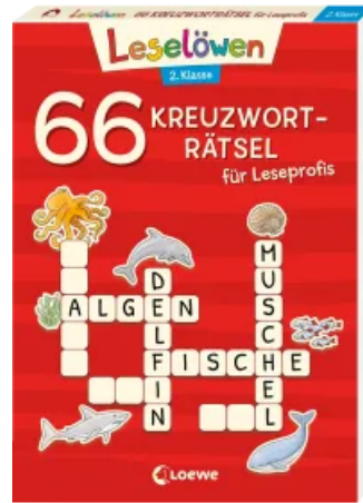
66 Kreuzworträtsel für Leseprofis - 2. Klasse (Rot) Taschenbuch