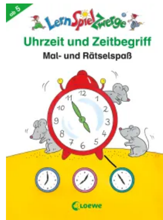
Uhrzeit und Zeitbegriff Unbekannt