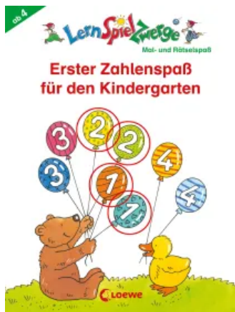
LernSpielZwerge - Erster Zahlenspaß für den Kindergarten Taschenbuch