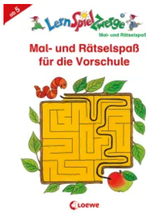
LernSpielZwerge - Mal- und Rätselspaß für die Vorschule Taschenbuch