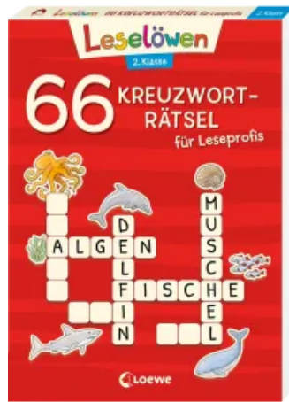
66 Kreuzworträtsel für Leseprofis - 2. Klasse (Rot) Taschenbuch