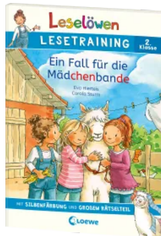
Leselöwen Lesetraining 2. Klasse - Ein Fall für die Mädchenbande Taschenbuch