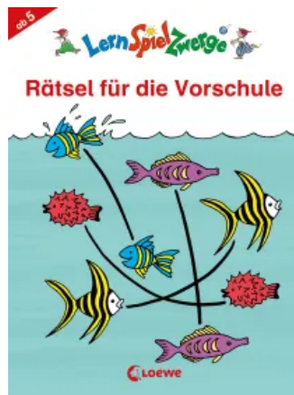
LernSpielZwerge - Rätsel für die Vorschule Taschenbuch