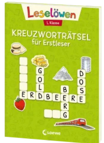
Leselöwen Kreuzworträtsel für Erstleser - 1. Klasse (Hellgrün) Taschenbuch