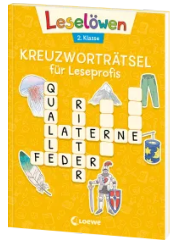
Leselöwen Kreuzworträtsel für Leseprofis - 2. Klasse (Sonnengelb) Taschenbuch