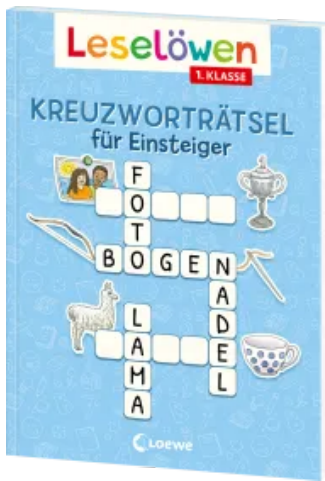
Leselöwen Kreuzworträtsel für Einsteiger - 1. Klasse (Himmelblau) Taschenbuch