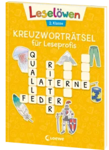
Leselöwen Kreuzworträtsel für Leseprofis - 2. Klasse (Sonnengelb) Taschenbuch