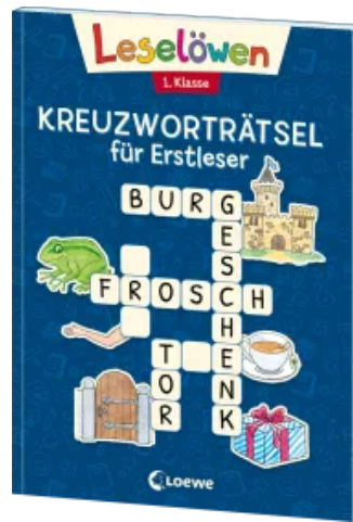
Leselöwen Kreuzworträtsel für Erstleser - 1. Klasse (Marineblau) Taschenbuch