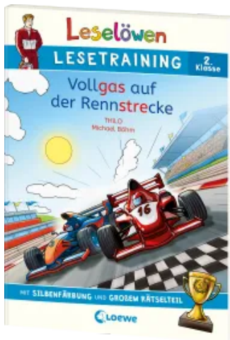
Leselöwen Lesetraining 2. Klasse - Vollgas auf der Rennstrecke Taschenbuch