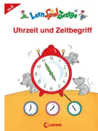
LernSpielZwerge - Uhrzeit und Zeitbegriff Taschenbuch