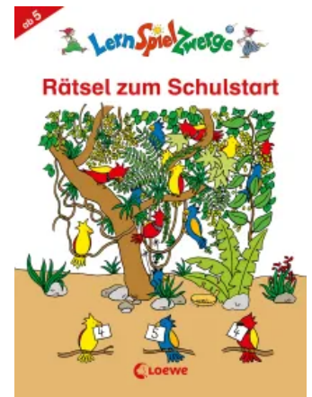
LernSpielZwerge - Rätsel zum Schulstart Taschenbuch