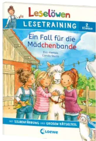
Leselöwen Lesetraining 2. Klasse - Ein Fall für die Mädchenbande Taschenbuch