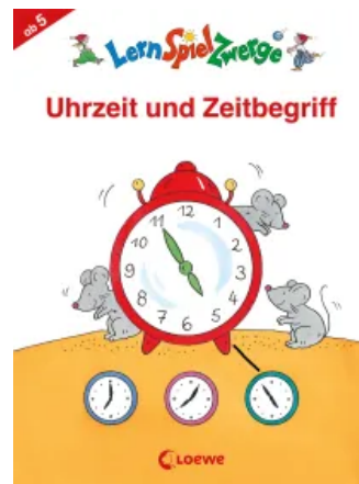
LernSpielZwerge - Uhrzeit und Zeitbegriff Taschenbuch