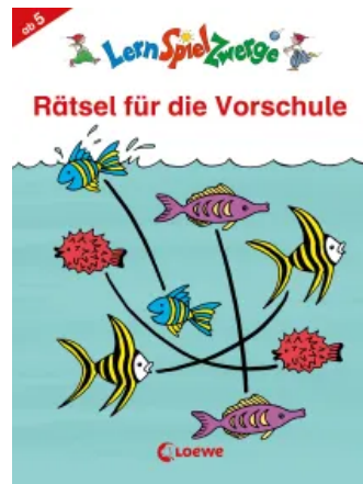
LernSpielZwerge - Rätsel für die Vorschule Taschenbuch