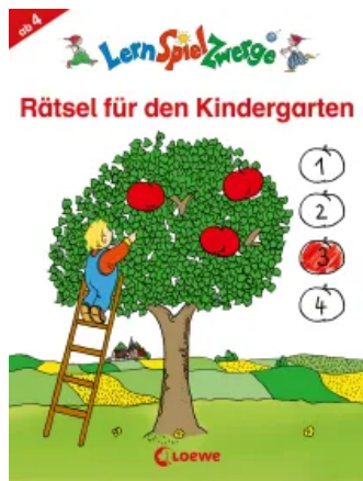
LernSpielZwerge - Rätsel für den Kindergarten Taschenbuch