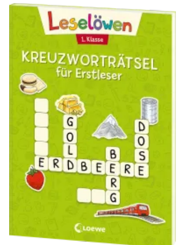
Leselöwen Kreuzworträtsel für Erstleser - 1. Klasse (Hellgrün) Taschenbuch