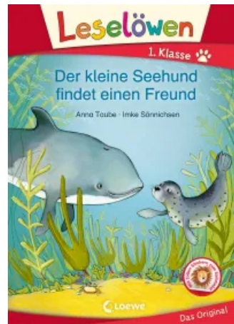
Leselöwen 1. Klasse - Der kleine Seehund findet einen Freund Hardcover