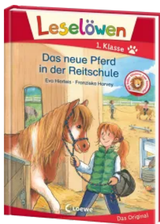
Leselöwen 1. Klasse - Das neue Pferd in der Reitschule Hardcover