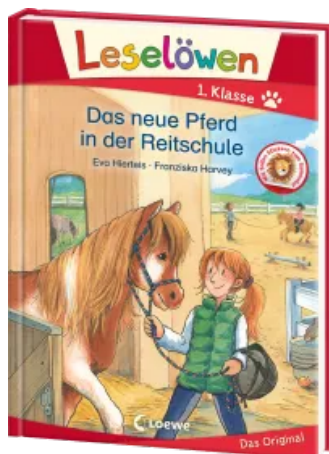
Leselöwen 1. Klasse - Das neue Pferd in der Reitschule Hardcover