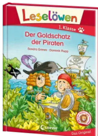
Leselöwen 1. Klasse - Der Goldschatz der Piraten Hardcover