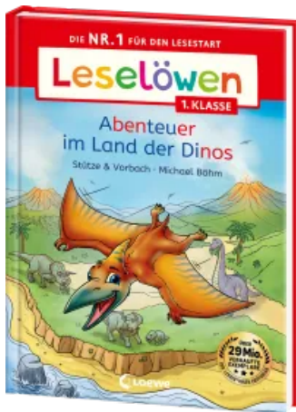
Leselöwen 1. Klasse - Abenteuer im Land der Dinos Hardcover