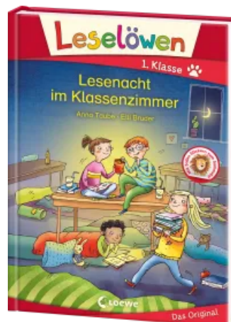
Leselöwen 1. Klasse - Lesenacht im Klassenzimmer Hardcover