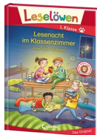
Leselöwen 1. Klasse - Lesenacht im Klassenzimmer Hardcover