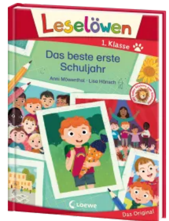
Leselöwen 1. Klasse - Das beste erste Schuljahr Hardcover