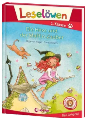
Leselöwen 1. Klasse - Die Hexe und der Muffin-Zauber Hardcover