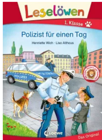
Leselöwen 1. Klasse - Polizist für einen Tag Hardcover