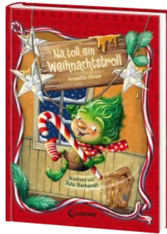
Na toll, ein Weihnachtstroll (Band 1) Hardcover