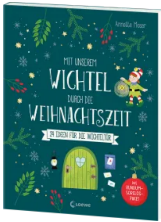
Mit unserem Wichtel durch die Weihnachtszeit Taschenbuch