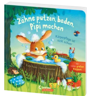
Zähne putzen, baden, Pipi machen - Körperpflege ist nicht schwer