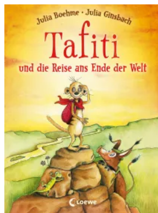
Tafiti und die Reise ans Ende der Welt (Band 1) Hardcover