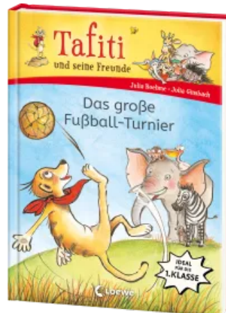
Tafiti und seine Freunde (Band 1) - Das große Fußball-Turnier Hardcover