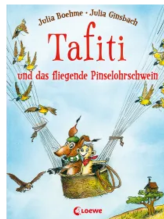
Tafiti und das fliegende Pinselohrschwein (Band 2) Hardcover