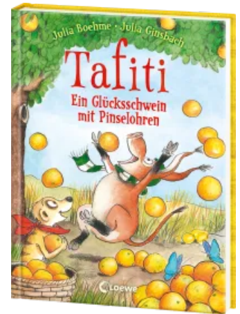
Tafiti (Band 24) - Ein Glücksschwein mit Pinselohren Hardcover