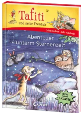
Tafiti und seine Freunde (Band 2) - Abenteuer unterm Sternenzelt Hardcover