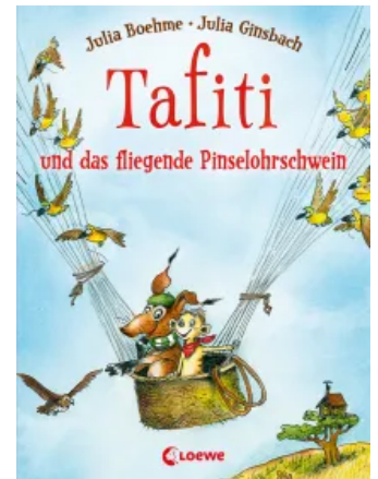
Tafiti und das fliegende Pinselohrschwein (Band 2) Hardcover