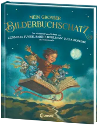
Mein großer Bilderbuchschatz Hardcover