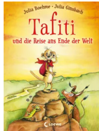
Tafiti und die Reise ans Ende der Welt (Band 1) Hardcover