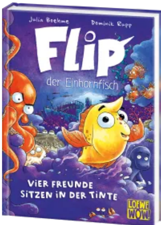
Flip, der Einhornfisch (Band 2) - Vier Freunde sitzen in der Tinte Hardcover