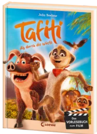
Tafiti - Ab durch die Wüste Hardcover