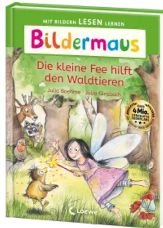
Bildermaus - Die kleine Fee hilft den Waldtieren Hardcover