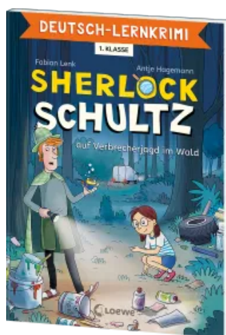
Deutsch-Lernkrimi - Sherlock Schultz auf Verbrecherjagd im Wald Taschenbuch