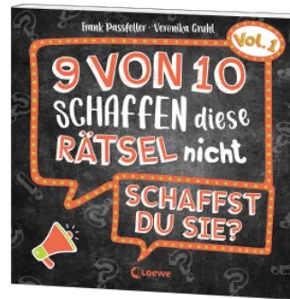
9 von 10 schaffen diese Rätsel nicht - schaffst du sie? - Vol. 1