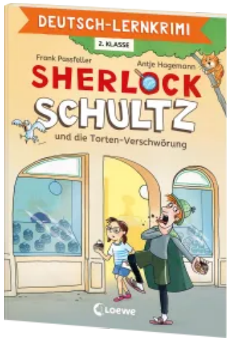
Deutsch-Lernkrimi - Sherlock Schultz und die Torten-Verschwörung Taschenbuch