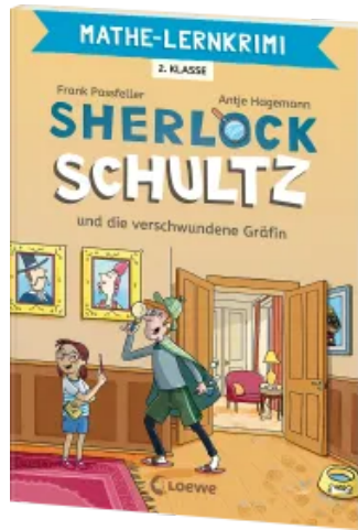
Mathe-Lernkrimi - Sherlock Schultz und die verschwundene Gräfin Taschenbuch