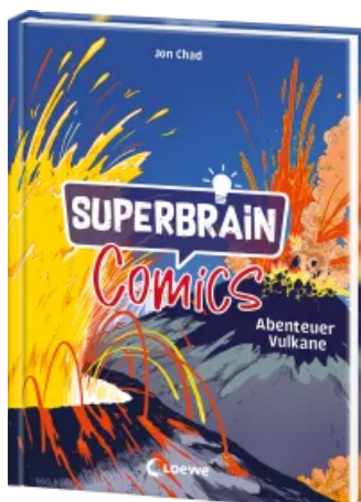
Superbrain-Comics - Abenteuer Vulkane Hardcover