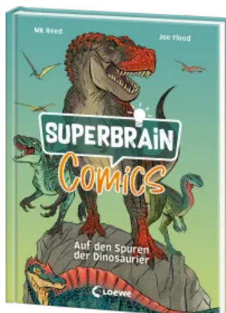
Superbrain-Comics - Auf den Spuren der Dinosaurier Hardcover