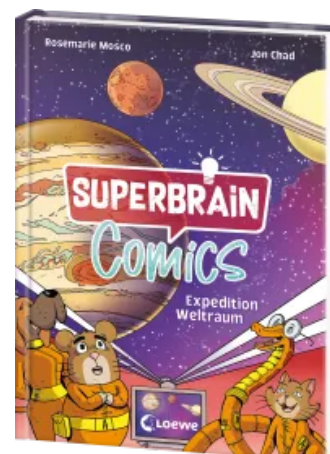
Superbrain-Comics - Expedition Weltraum Hardcover