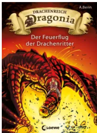
Drachenreich Dragonia (Band 2) – Der Feuerflug der Drachenritter Unbekannt