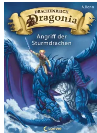
Drachenreich Dragonia (Band 1) – Angriff der Sturmdrachen Unbekannt