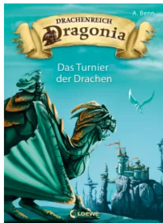
Drachenreich Dragonia (Band 4) – Das Turnier der Drachen Hardcover