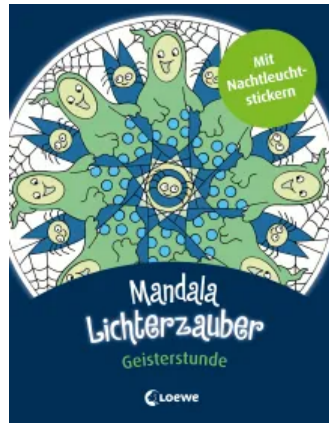
Mandala-Lichterzauber - Geisterstunde Taschenbuch