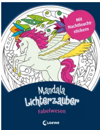
Mandala-Lichterzauber - Fabelwesen Taschenbuch