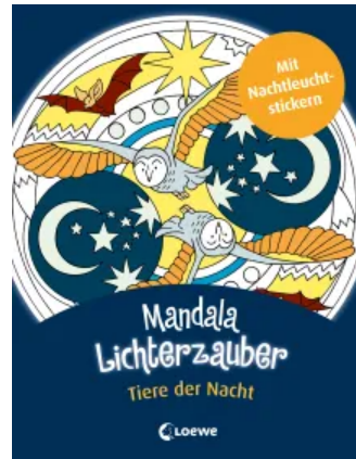
Mandala-Lichterzauber - Tiere der Nacht Taschenbuch