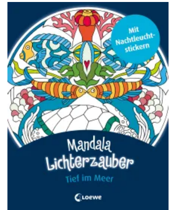
Mandala-Lichterzauber - Tief im Meer Taschenbuch