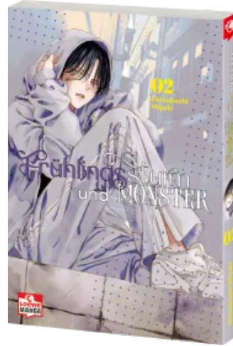
Frühlingssturm und Monster 02 Taschenbuch