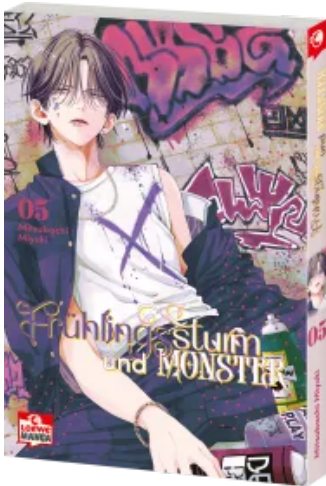
Frühlingssturm und Monster 05 Taschenbuch