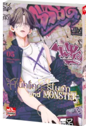
Frühlingssturm und Monster 05 Taschenbuch