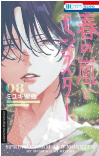
Frühlingssturm und Monster 08 Taschenbuch