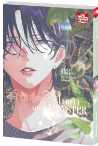
Frühlingssturm und Monster 08 Taschenbuch