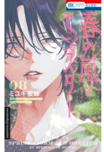
Frühlingssturm und Monster 08 Taschenbuch