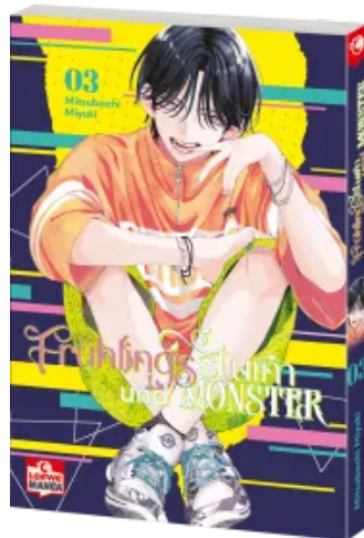
Frühlingssturm und Monster 03 Taschenbuch