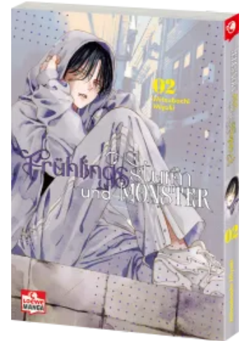
Frühlingssturm und Monster 02 Taschenbuch