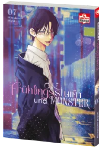
Frühlingssturm und Monster 07 Taschenbuch