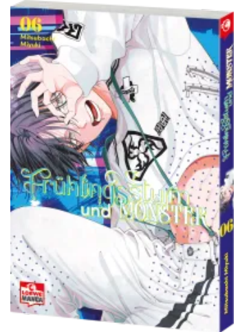
Frühlingssturm und Monster 06 Taschenbuch