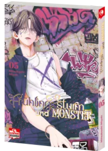
Frühlingssturm und Monster 05 Taschenbuch