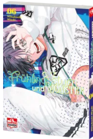
Frühlingssturm und Monster 06 Taschenbuch