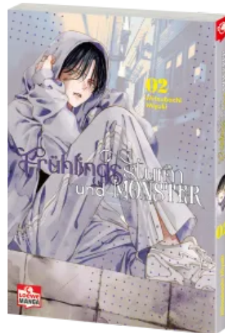
Frühlingssturm und Monster 02 Taschenbuch