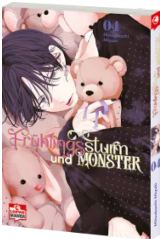
Frühlingssturm und Monster 04 Taschenbuch