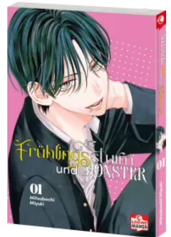
Frühlingssturm und Monster 01 Taschenbuch