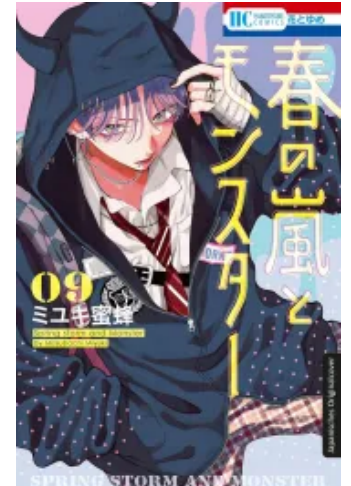
Frühlingssturm und Monster 09 Taschenbuch