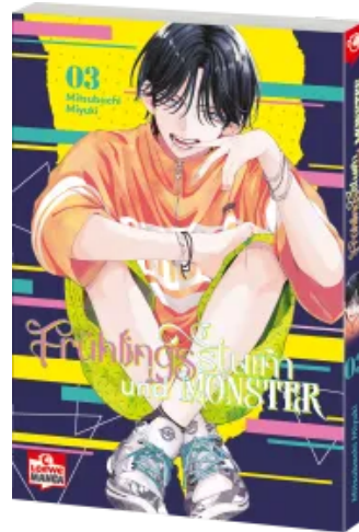
Frühlingssturm und Monster 03 Taschenbuch