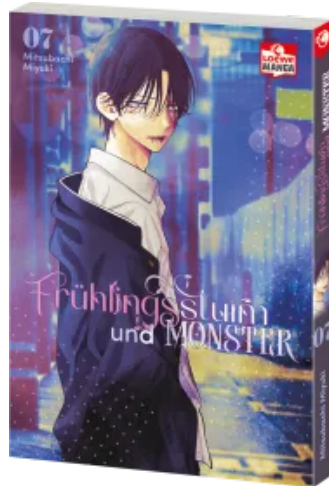
Frühlingssturm und Monster 07 Taschenbuch