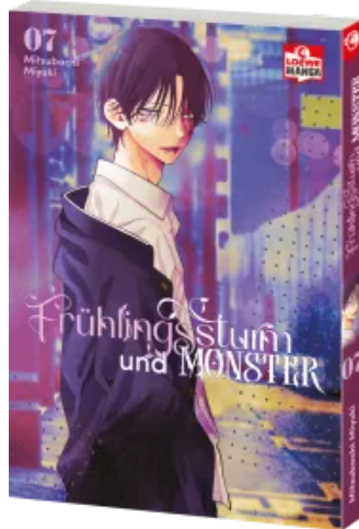
Frühlingssturm und Monster 07 Taschenbuch