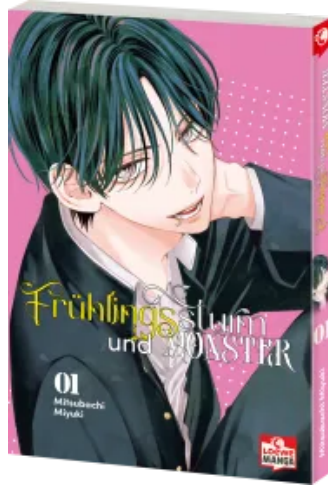
Frühlingssturm und Monster 01 Taschenbuch