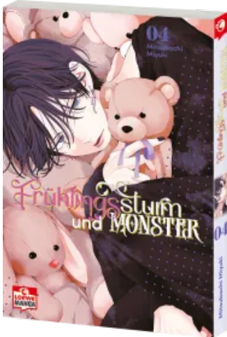
Frühlingssturm und Monster 04 Taschenbuch