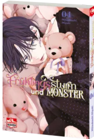
Frühlingssturm und Monster 04 Taschenbuch