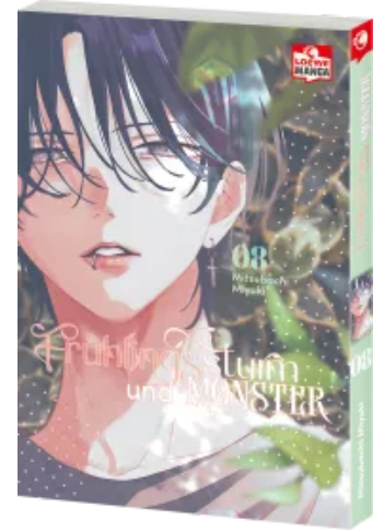
Frühlingssturm und Monster 08 Taschenbuch