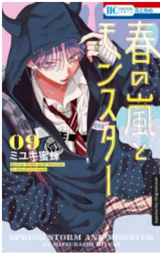
Frühlingssturm und Monster 09 Taschenbuch