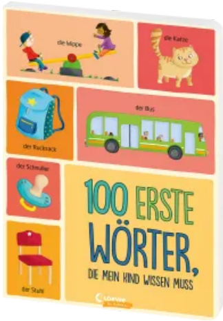
100 erste Wörter, die mein Kind wissen muss Hardcover