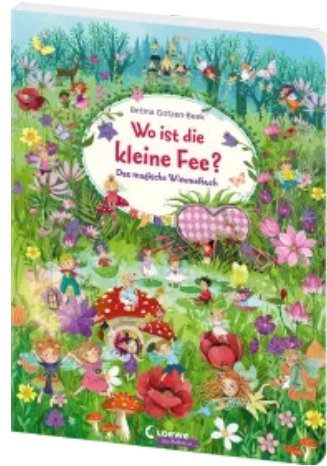
Wo ist die kleine Fee? Hardcover