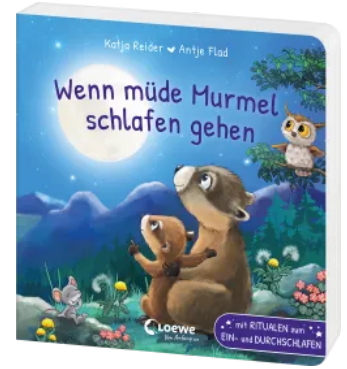
Wenn müde Murrel schlafen gehen Hardcover