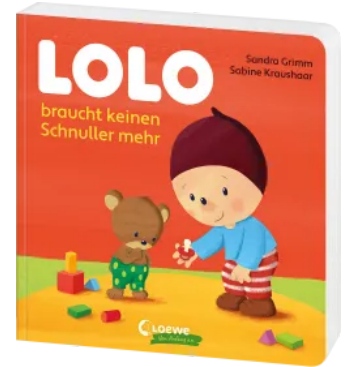
Lolo braucht keinen Schnuller mehr Hardcover