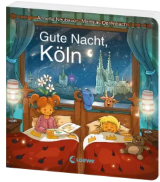
Gute Nacht, Köln Hardcover