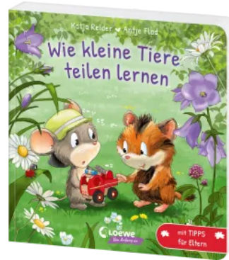
Wie kleine Tiere teilen lernen Hardcover