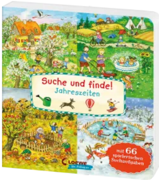
Suche und finde! Jahreszeiten Hardcover