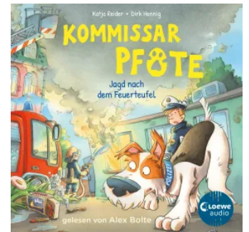
Kommissar Pfote (Band 8) - Jagd nach dem Feuerteufel Hörbuch