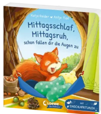
Mittagsschlaf, Mittagsruh, schon fallen dir die Augen zu zu Hardcover