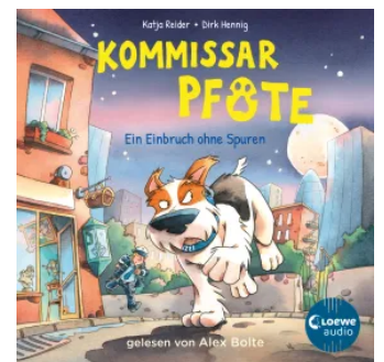
Kommissar Pfote (Band 6) - Ein Einbruch ohne Spuren Hörbuch