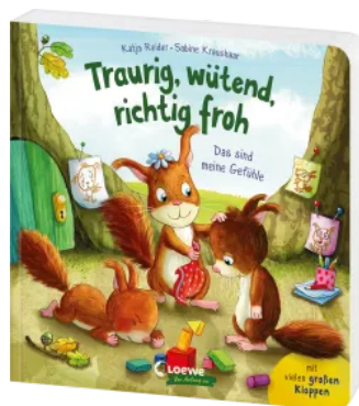
Traurig, wütend, richtig froh - das sind meine Gefühle Hardcover