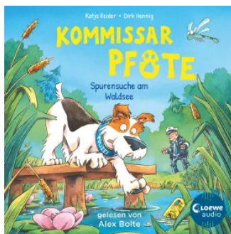
Kommissar Pfote (Band 7) - Spurensuche am Waldsee Hörbuch