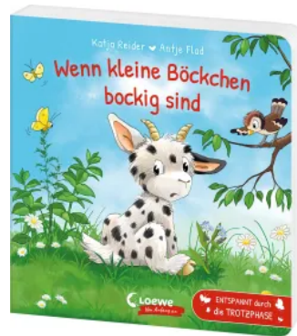
Wenn kleine Böckchen bockig sind Hardcover