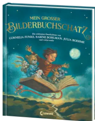
Mein großer Bilderbuchschatz Hardcover