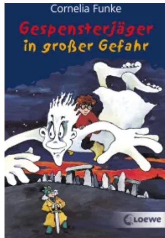
Gespensterjäger in großer Gefahr Unbekannt