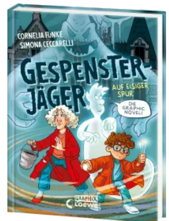
Gespensterjäger auf eisiger Spur (Band 1) - Die Graphic Novel Hardcover