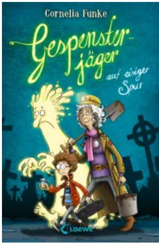
Gespensterjäger auf eisiger Spur (Band 1) Hardcover