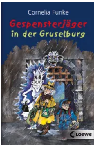
Gespensterjäger in der Gruselburg Taschenbuch