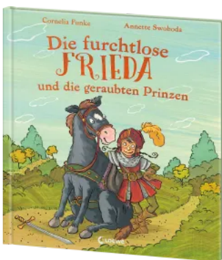
Die furchtlose Frieda und die geraubten Prinzen Hardcover