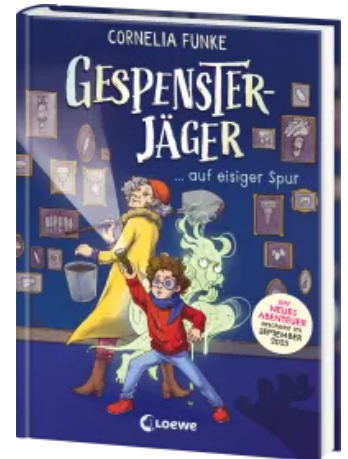
Gespensterjäger auf eisiger Spur (Band 1) - Mit 8 neu illustrierten Farbseiten Hardcover