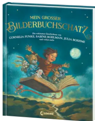
Mein großer Bilderbuchschatz Hardcover