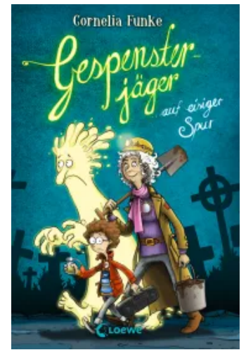
Gespensterjäger auf eisiger Spur (Band 1) Hardcover