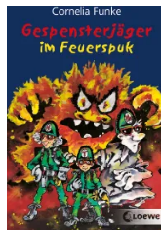
Gespensterjäger im Feuerspuk Taschenbuch