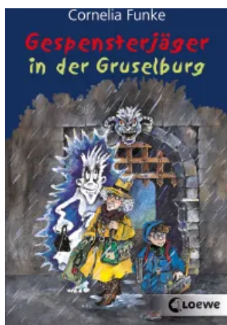
Gespensterjäger in der Gruselburg (Band 3) Taschenbuch