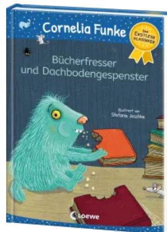
Bücherfresser und Dachbodengespenster Hardcover