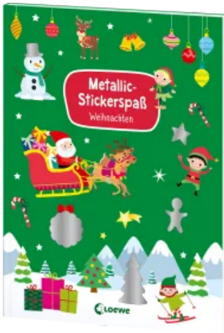
Metallic-Stickerspaß - Weihnachten Taschenbuch