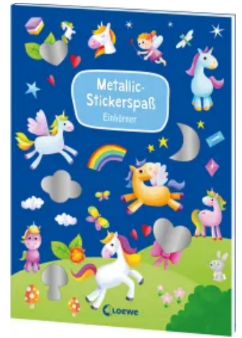
Metallic-Stickerspaß - Einhörner Taschenbuch