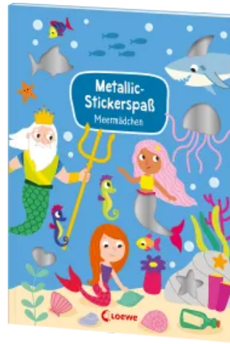
Metallic-Stickerspaß - Meermädchen Taschenbuch