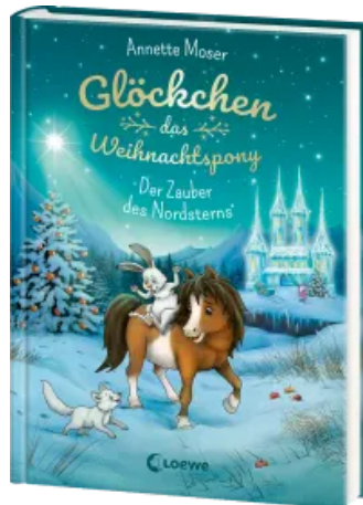
Glöckchen, das Weihnachtspony (Band 2) - Der Zauber des Nordsterns Hardcover