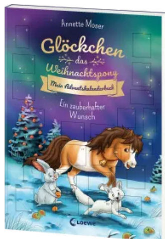
Glöckchen, das Weihnachtspony Mein Adventskalenderbuch - Ein zauberhafter Wunsch Taschenbuch