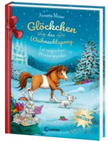
Glöckchen, das Weihnachtspony - Ein magisches Winterwunder Hardcover