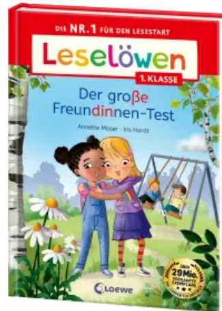
Leselöwen 1. Klasse - Der große Freundinnen-Test Hardcover