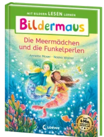
Bildermaus - Die Meermädchen und die Funkelperlen Hardcover