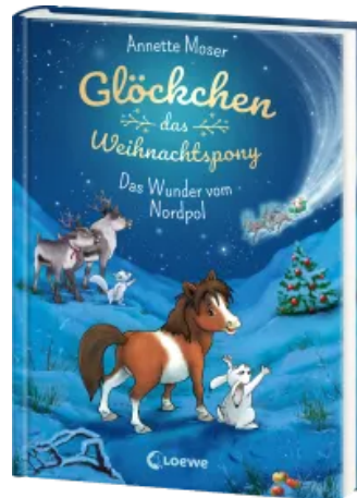
Glöckchen, das Weihnachtspony (Band 1) - Das Wunder vom Nordpol Hardcover