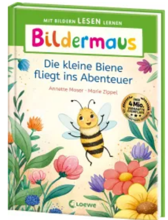
Bildermaus - Die kleine Biene fliegt ins Abenteuer Hardcover