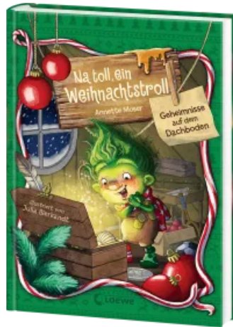
Na toll, ein Weihnachtstroll (Band 2) - Geheimnisse auf dem Dachboden Hardcover