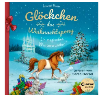
Glöckchen, das Weihnachtspony - Ein magisches Winterwunder Hörbuch