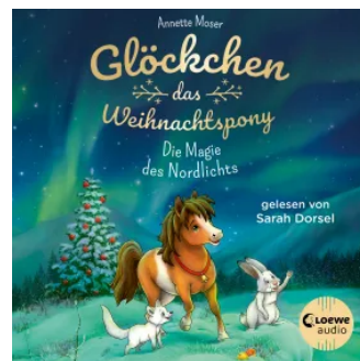
Glöckchen, das Weihnachtspony (Band 3) - Die Magie des Nordlichts Hörbuch