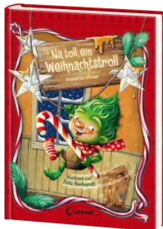
Na toll, ein Weihnachtstroll (Band 1) Hardcover