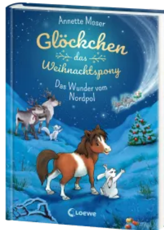
Glöckchen, das Weihnachtspony (Band 1) - Das Wunder vom Nordpol Hardcover