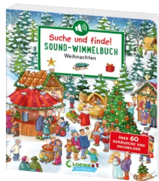
Suche und finde! Sound-Wimmelbuch - Weihnachten Hardcover