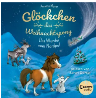
Glöckchen, das Weihnachtspony (Band 1) - Das Wunder vom Nordpol Hörbuch