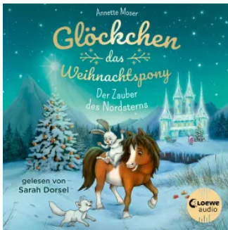
Glöckchen, das Weihnachtspony (Band 2) - Der Zauber des Nordsterns Hörbuch