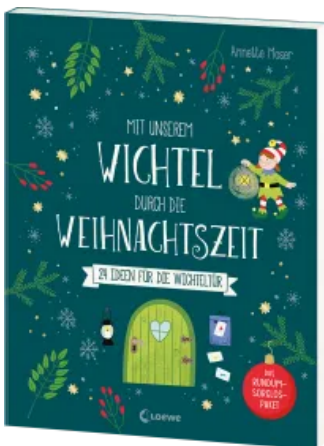
Mit unserem Wichtel durch die Weihnachtszeit Taschenbuch