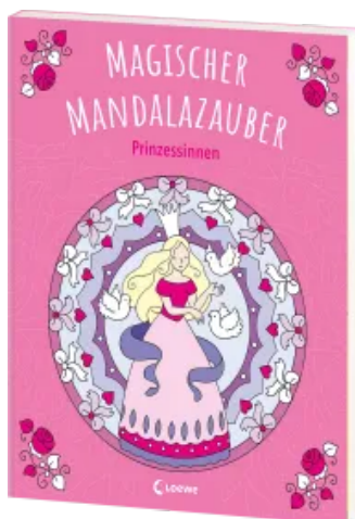
Magischer Mandalazauber - Prinzessinnen Taschenbuch