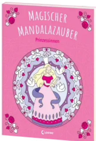
Magischer Mandalazauber - Prinzessinnen Taschenbuch