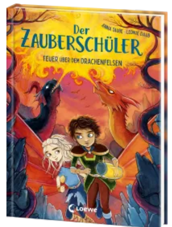
Der Zauberschüler (Band 6) - Feuer über dem Drachenfelsen Hardcover