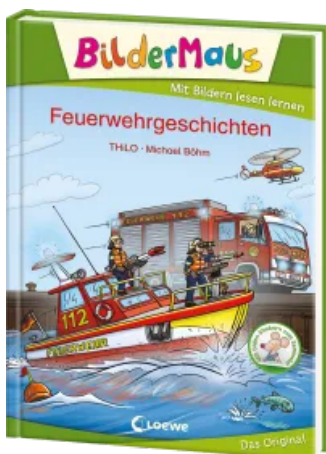
Bildermaus - Feuerwehrgeschichten Hardcover