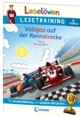
Leselöwen Lesetraining 2. Klasse - Vollgas auf der Rennstrecke Taschenbuch