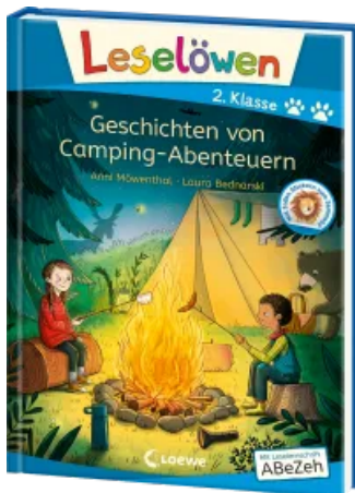
Leselöwen 2. Klasse - Geschichten von Camping- Abenteuern Hardcover