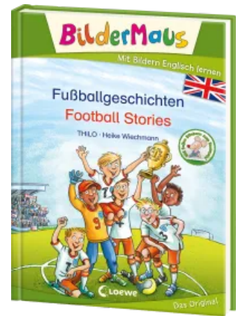
Bildermaus - Mit Bildern Englisch lernen - Fußballgeschichten - Football Stories Hardcover