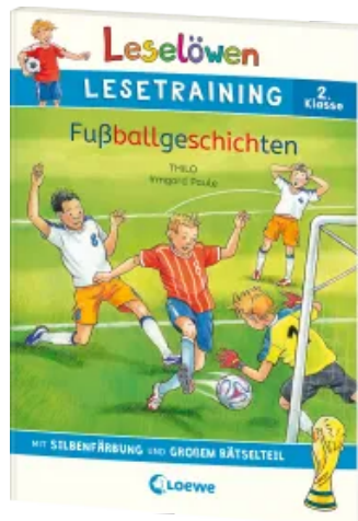
Leselöwen Lesetraining 2. Klasse - Fußballgeschichten Taschenbuch