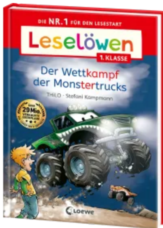
Leselöwen 1. Klasse - Der Wettkampf der Monstertrucks Hardcover