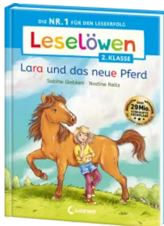
Leselöwen 2. Klasse - Lara und das neue Pferd Hardcover