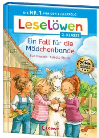
Leselöwen 2. Klasse - Ein Fall für die Mädchenbande Hardcover