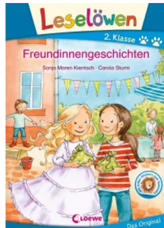
Leselöwen 2. Klasse - Freundinnengeschichten Hardcover