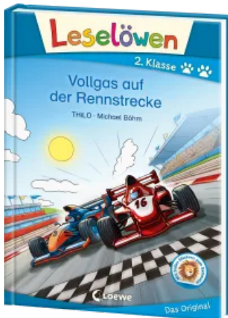
Leselöwen 2. Klasse - Vollgas auf der Rennstrecke Hardcover