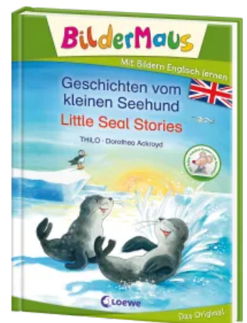
Bildermaus - Mit Bildern Englisch lernen - Geschichten vom kleinen Seehund - Little Seal Stories Hardcover