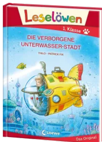
Leselöwen 1. Klasse - Die verborgene Unterwasser- Stadt (Großbuchstabenausgabe) Hardcover