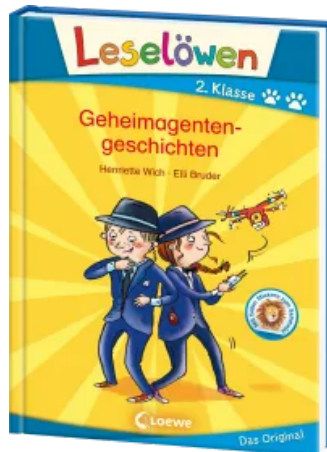
Leselöwen 2. Klasse - Geheimagentengeschichten Hardcover