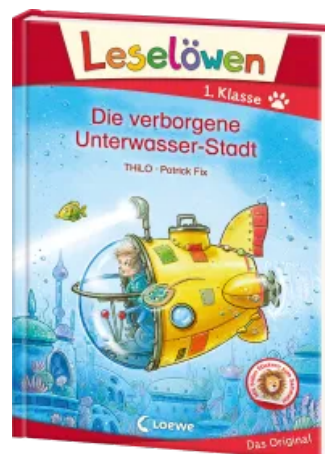
Leselöwen 1. Klasse - Die verborgene Unterwasser- Stadt Hardcover