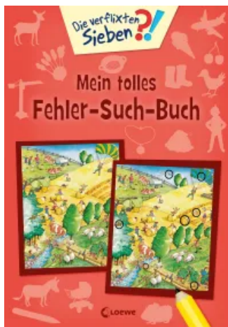
Die verflixten Sieben - Mein tolles Fehler-Such-Buch Taschenbuch