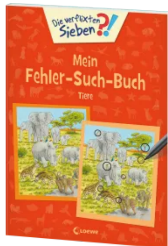
Die verflixten Sieben - Mein Fehler-Such-Buch - Tiere Taschenbuch