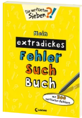
Mein extradickes Fehler-Such-Buch (gelb) Taschenbuch