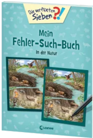
Die verflixten Sieben - Mein Fehler-Such-Buch - In der Natur Taschenbuch