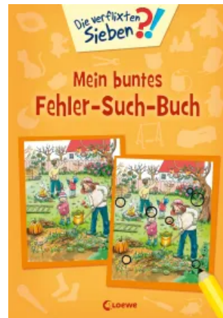
Die verflixten Sieben - Mein buntes Fehler-Such-Buch Taschenbuch