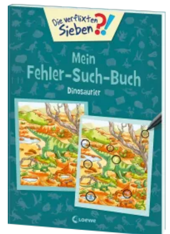
Die verflixten Sieben - Mein Fehler-Such-Buch - Dinosaurier Taschenbuch