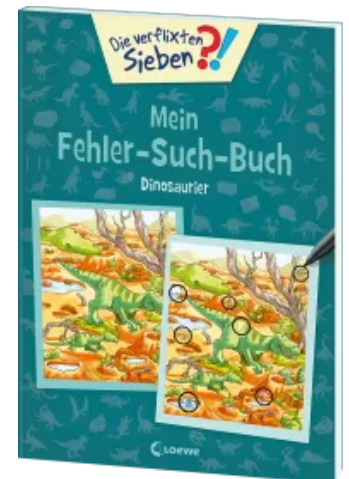
Die verflixten Sieben - Mein Fehler-Such-Buch - Dinosaurier Taschenbuch