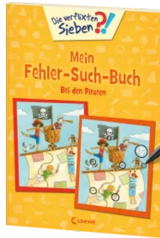
Die verflixten Sieben - Mein Fehler-Such-Buch - Bei den Piraten Taschenbuch